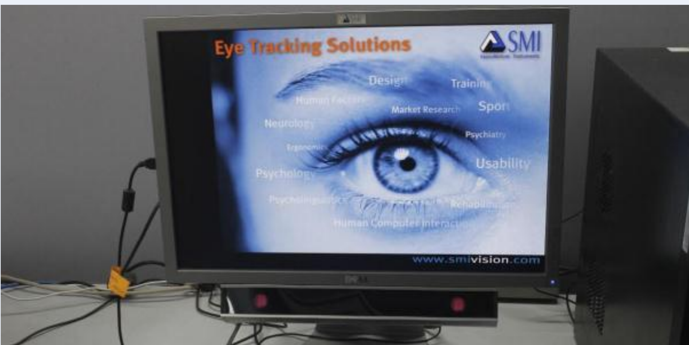
Traqueur oculaire SMI (Kumar et al. 2016).

Le trouble du spectre de l'autisme (TSA) est présent depuis la naissance et peut varier en intensité tout au long de la vie. Ce trouble engendre des situations de handicap, ce qui impacte son porteur, mais également les aidants familiaux. Il est donc nécessaire de poser un diagnostic le plus précocement possible, afin de pouvoir proposer une prise en charge adaptée et accroître les répercussions positives sur le développement de l'enfant TSA (HAS, 2018).