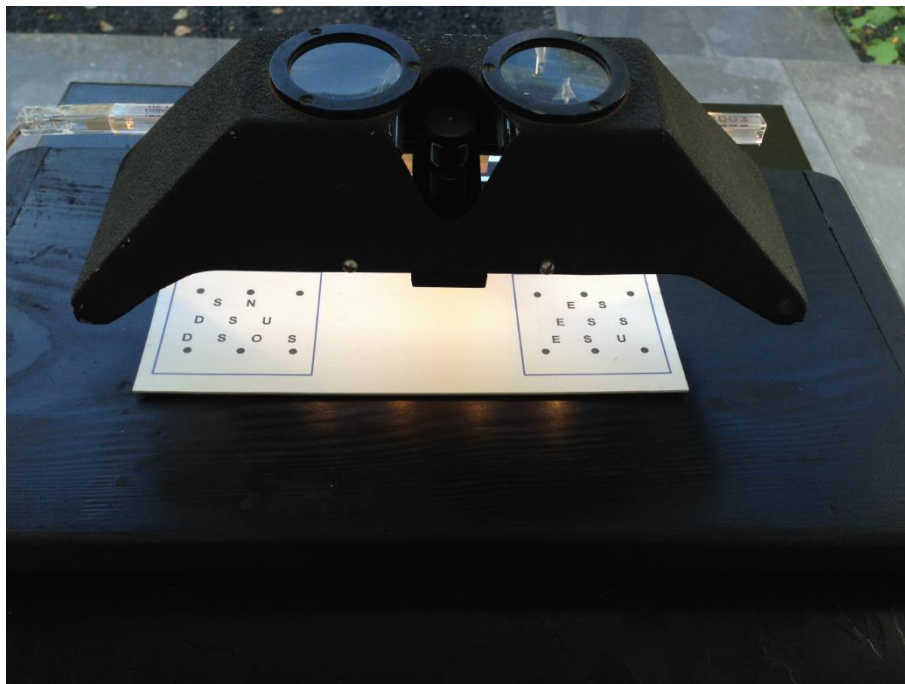
Fig. 4 Francis Édeline, Sans titre , stéréoscope avec « schizopoèmes », détail, 2021.

Ma contribution à ce dossier restera donc modeste, marginale, et négative.