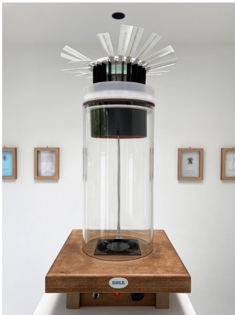
Fig. 5 Francis Édeline, Éole (Anémoscope) , 2021.

F. É. : En effet, puisque l'art est (cela au moins est admis par tous) un système de signes, il est susceptible d'une analyse sémiotique. D'autre part si l'art est recherché, c'est parce qu'il procure une satisfaction spécifique, ou provoque des réactions d'humeurs diverses. Il ne peut donc être question de mettre entre parenthèses cet aspect essentiel, sous prétexte qu'il serait « d'un autre ordre ». Ceci dit, beaucoup reste à faire pour départager (ou synthétiser) les diverses approches que j'évoquais plus haut.