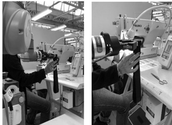
Figure 3 - Poste collaboratif

Après avoir validé le fait que le poste collaboratif n'apporterait aucun risque vis à vis des facteurs humains, nous avons placé une machine à coudre à côté du cobot et modifié sa programmation pour offrir les élastiques coupés directement à l'opératrice (Figure 3).