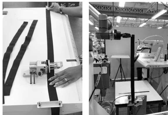
Figure 1 - Ancien poste de coupe vs poste de coupe automatique

3) Exécution du programme (actionnement d'un vérin au niveau du distributeur, saisie de l'élastique, déplacement du bras dans l'axe pour la mesure de taille, actionnement de la coupe, dépose de l'élastique coupé dans un bac). L'opération s'effectuait sans interruption tant que le capteur détectait la présence d'élastique et jusqu'à ce que la quantité renseignée auparavant soit atteinte.