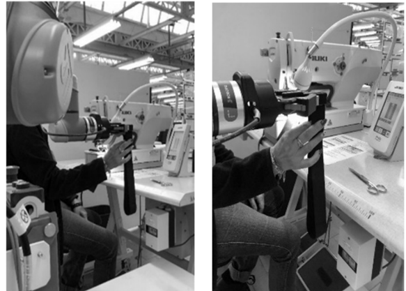
Figure 3 - Poste collaboratif

Après avoir validé le fait que le poste collaboratif n'apporterait aucun risque vis à vis des facteurs humains, nous avons placé une machine à coudre à côté du cobot et modifié sa programmation pour offrir les élastiques coupés directement à l'opératrice (Figure 3).