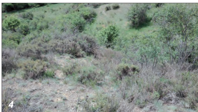
Figures 1 à 6. – Cryptocephalus celtibericus Suffrian, 1848 : 1) Mâle (longueur : 2,1 mm), habitus (a) et détail de la tête (b). Clichés Philippe Ponel. 2) Femelle (longueur : 3 mm), habitus (a) et détail de la tête (b). Clichés Philippe Ponel. 3) Adulte in natura . Cliché Hervé Bouyon. 4) Biotope de C. celtibericus , 27 juin 2022, Coll Tort, Nahuja (Pyrénées-Orientales). Cliché Pierre Cantot.