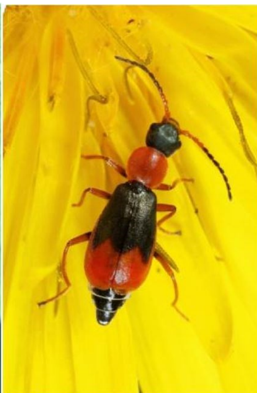
Figure 2 : Cerapheles lateplagiatus , ♀.