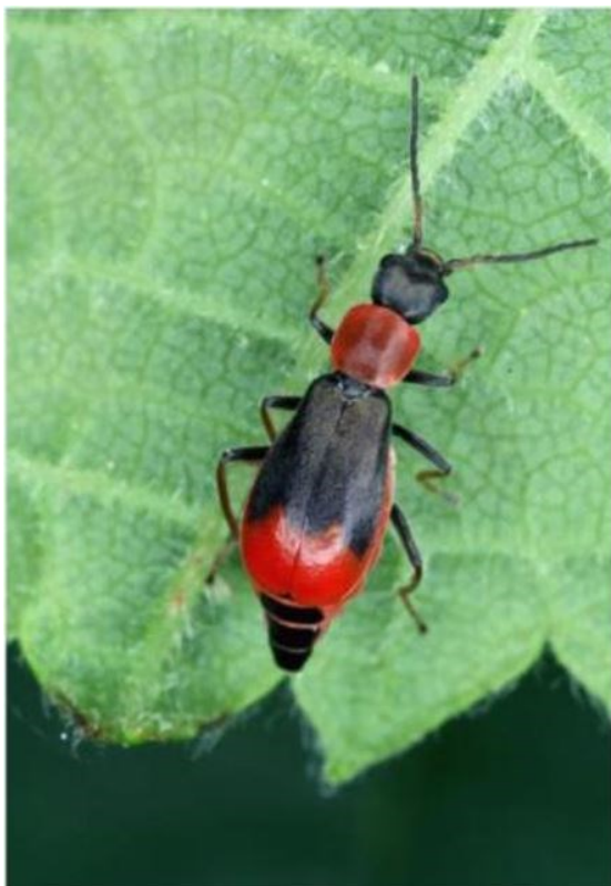
Figure 1 : Cerapheles terminatus , ♀.

Cerapheles lateplagiatus : Antennes jaunes, antennomères V-XI brun jaunâtre. Pattes jaunes, le quart basal des méso- et métafémurs bruns. Élytres verts à macule apicale jaune occupant le tiers apical et à liseré marginal remontant jusqu'au calus huméral. Longueur totale : ♂ de 3,9 à 4,2 mm, moyenne 4,0 mm ; ♀ de 3,5 à 4,3 mm, moyenne 3,9 mm (Fig. 2)