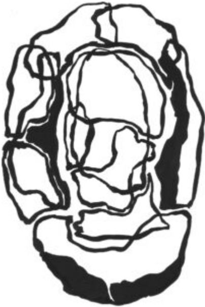
Illustration d'Emmanuel Constant

habitant·es de la capacité de comprendre et de réparer leur habitat.