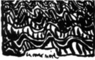
Illustration d'Emmanuel Constant