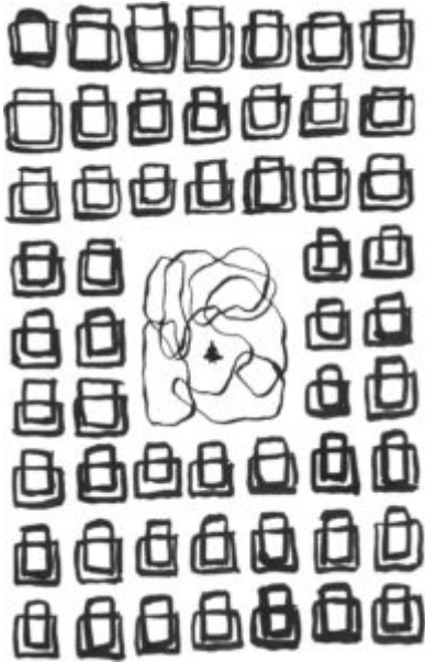
Illustration d'Emmanuel Constant

Mathias Rollot : Les biorégions m'ont permis de questionner les grands principes de l'architecture qui se croit parfois universelle ou intemporelle. Après ma thèse, j'ai trouvé un travail à Montpellier, et je faisais les allers-retours avec ma vie personnelle à Paris. Très rapidement, je me suis rendu compte que je ne connaissais pas le genre d'arbre qui pousse là-bas, la géologie, les vents, les taux d'humidité... Donc impossible de déterminer les matériaux les plus pertinents à utiliser ni où se les procurer par exemple. C'est une approche qui permet de rester modeste, d'éviter les grands discours.