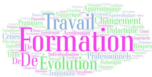
Texte de cadrage