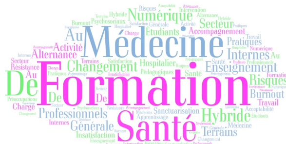
Résumé long de cette communication