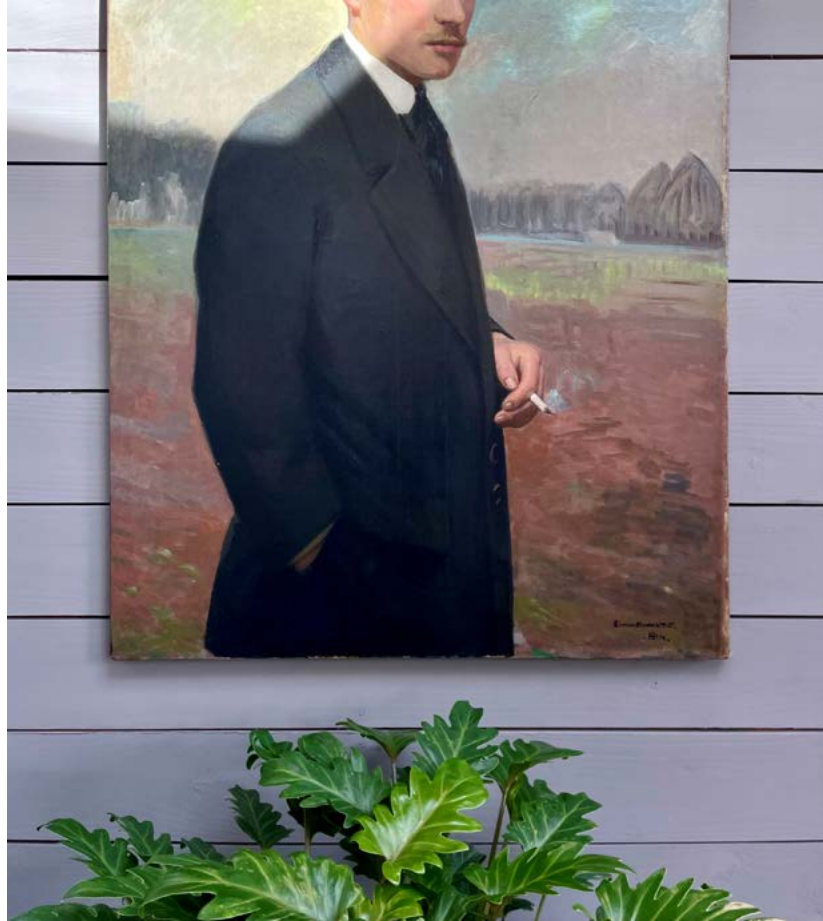
Simon Monnatte, Portrait d'un jeune homme aux yeux bleus fumant une cigarette , 1914.