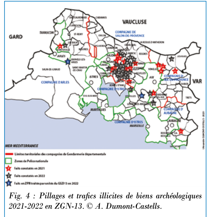
Fig. 4 : Pillages et trafics illicites de biens archéologiques 2021-2022 en ZGN-13.

que la détection clandestine c'est un dépôt monétaire découvert chaque mois, un millier de détectoristes identifiés, 5000 ha prospectés par an, 300 vendeurs réguliers sous pseudonymes sur les sites de ventes en ligne, 3000 objets archéologiques vendus pour le Vaucluse et 2 millions de monnaies anciennes découvertes clandestinement en 30 ans.