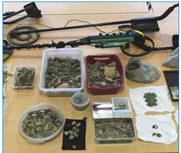
Fig. 2 : Saisie chez un prospecteur de matériels de détection métallique, d'objets archéologiques et de revues spécialisées.

par l'étude et d'autre part de la destruction avec ou sans usage du détecteur de métaux. Cette action illégale expose les infracteurs à des poursuites (Fig. 2). Ces actes illicites, préjudiciables à la ressource archéologique, traduisent surtout l'ignorance, la méconnaissance ou le déni de certains prospecteurs pour le contexte d'étude et l'archéologie. Certains adhèrent à une approche rétro-