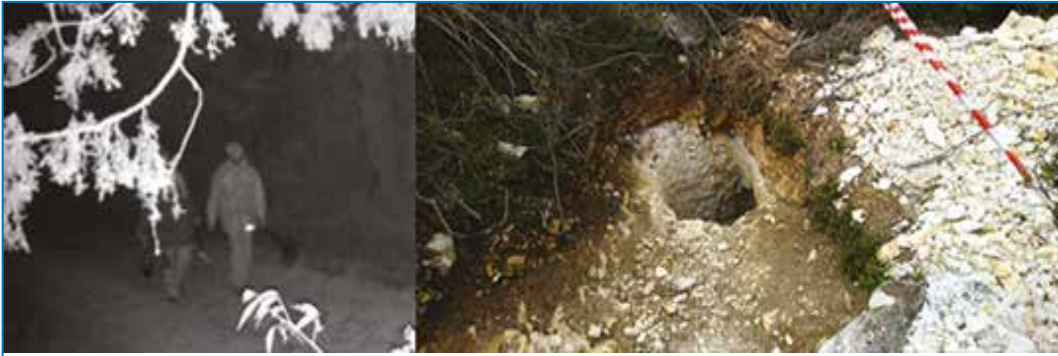
Fig. 1 : À gauche, deux détectoristes de métaux clandestins. © Anonyme. À droite, une excavation faite au marteau-piqueur sur un site de carrière antique de plein air. © A. Dumont-Castells.

Hardy estimait à 109 375 la population des détectoristes de métaux français (6). Chacun se met en quête de fabuleux trésors (Fig. 1). Généralement, ce sont ceux des Templiers ; dans l'Aude, à Rennes-le-Château, c'est celui de l'abbé Saunière (1852-1917). Cette recherche d'objets anciens se fait près des lieux de batailles (Alésia, etc.) parfois en s'aidant de l'imagerie aérienne accessible en ligne. Un sondage de 2010 de la Fédération nationale des utilisateurs de détecteurs de métaux (FNUDEM) informait que 68 % des usagers de détecteurs de métaux faisaient des recherches avant de partir prospecter : 51 % d'entre eux gardaient leurs trouvailles archéologiques tandis que 26 % les revendaient (7). En 2015, les médias évoquent de plus en plus les affaires judiciaires et les jugements. Depuis la fin 2021, neuf reportages ont été diffusés par TF1, BFMTV, France 2 et M6. En plus de la presse, le public ne méconnaît plus le sujet. Avant 2020, nous constatons que ces obstacles se traduisaient par un manque de savoir-faire, la non-priorisation « missionnelle », l'absence de synergie des services de l'État concernés par la lutte contre les atteintes portées au patrimoine des vestiges. De plus, certaines carences subsistent au sein des outils d'enregistrements des faits, notamment pour la classification des infractions au patrimoine archéologique. Ce qui affecte le traitement des données statistiques.