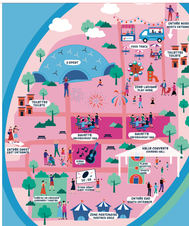
Carte 2 : plan schématique du « village rugby »

a mis en forme : Police :11 pt, Police de script complexe :11 pt