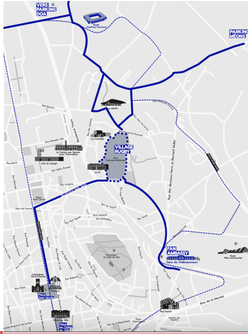
Carte 1 : implantation du « village rugby » dans la ville de Saint-Etienne (en gras, les fan walks permettant de s'y rendre)

a mis en forme : Police :11 pt, Police de script complexe :11 pt