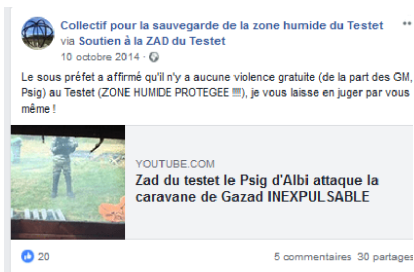
Figure 3. Publication : utilisation des vidéos automédias de la ZAD par le Collectif Testet

De même, avant la mort de Rémi Fraisse, les violences des forces de l'ordre contre les occupants de la ZAD ont pu provoquer de brefs déplacements éditoriaux, comme le prouve par exemple cet appui du Collectif Testet sur un contenu automédia de la ZAD. Si ce recours aux contenus de l'autre entité mobilisée semble dicté par l'explosion de la conflictualité, il témoigne cependant de leur relative solidarité :