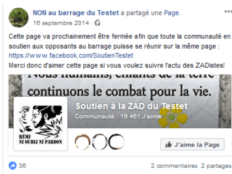
Figure 4. Publication : migration de la Page

Pour terminer, cette stratégie militante prend plus explicitement la forme de « l'articulation » ou de « l'intégration » au moyen d'un troisième espace Facebook 5 :