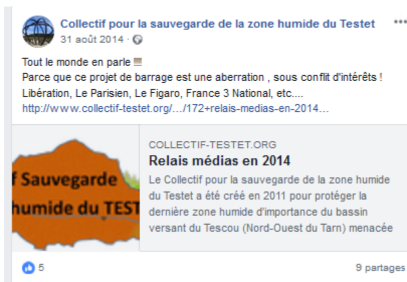
Figure 2. Publication. Le Collectif Testet et la couverture journalistique de la mobilisation

costaud. [...] Pour moi ça fait partie de la stratégie pour essayer de faire reculer l'adversaire » (Porte-parole du Collectif Testet).