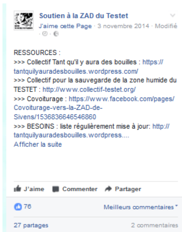
Figure 5. Publication : mise en valeur des ressources info-communicationnelles des différents groupements

Cette Page « Soutien Testet » est numériquement la plus importante de la mobilisation, en étant suivie par plus de 19000 utilisateurs. Son éditorialisation consiste d'abord à rapprocher symboliquement des pans entiers de la contestation : entre entités liguées contre le barrage de Sivens, mais également entre mobilisations disséminées en France et ailleurs ; par conséquent dans une double logique intra-lutte et inter-luttes. En termes d'animation éditoriale, la Page vise à valoriser les informations tirées des deux sites Internet militants principaux du conflit.