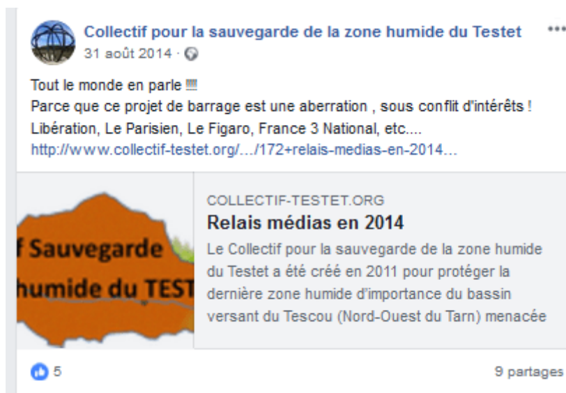
Figure 2. Publication. Le Collectif Testet et la couverture journalistique de la mobilisation

costaud. [...] Pour moi ça fait partie de la stratégie pour essayer de faire reculer l'adversaire » (Porte-parole du Collectif Testet).