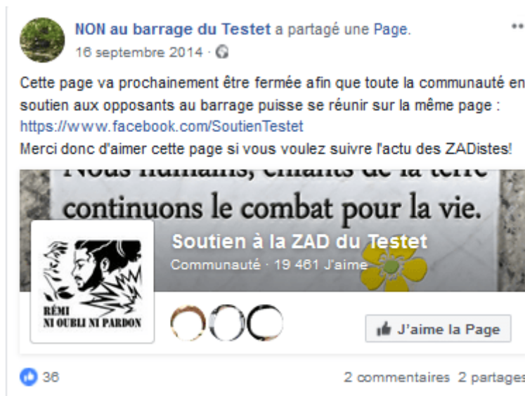
Figure 4. Publication : migration de la Page

Pour terminer, cette stratégie militante prend plus explicitement la forme de « l'articulation » ou de « l'intégration » au moyen d'un troisième espace Facebook 5 :