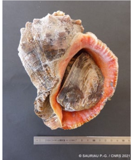
Rapana venosa (D)