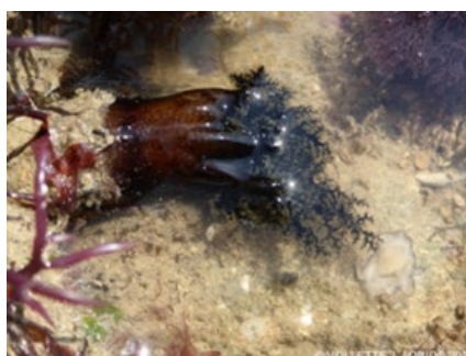
Aslia lefevrei (D)