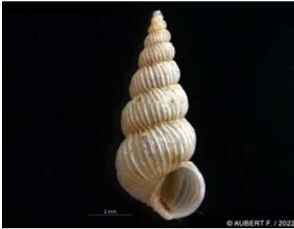
Epitonium clathratulum (C)