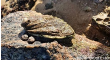
Haliotis tuberculata (A)