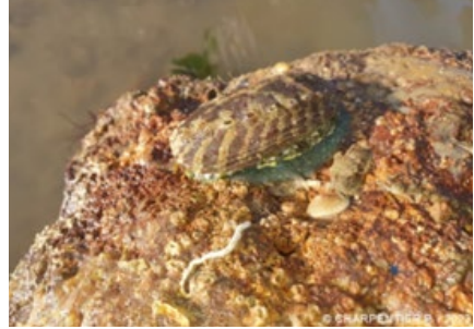
Haliotis tuberculata (B)