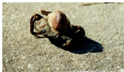
Carcinus maenas et Crepidula fornicata (F)