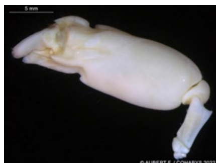
Alpheus macrocheles gnathopode (C)