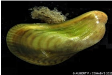
Arcuatula senhousia (E)