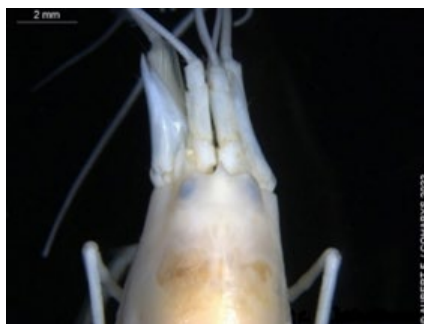
Alpheus macrocheles front (B)