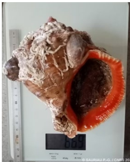
Rapana venosa et Crepidula fornicata (G)