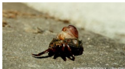
Carcinus maenas et Crepidula fornicata (E)