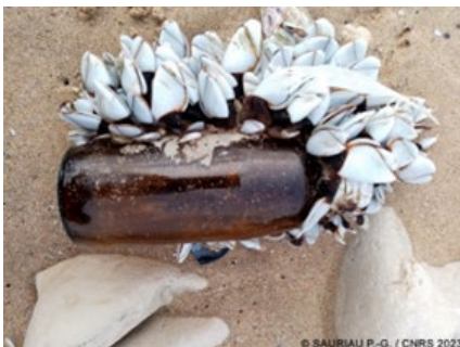
Lepas (Lepas) anatifera (F)