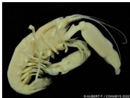
Alpheus macrocheles (A)