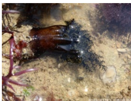
Aslia lefevrei (D)