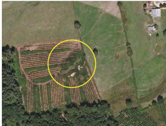
Figure 1 – La mine de La Verrerie à Villosanges

Il reste enfin à démontrer que le programme MINEDOR mérite bien son nom, et que les minières en question sont bien des mines... d'or.