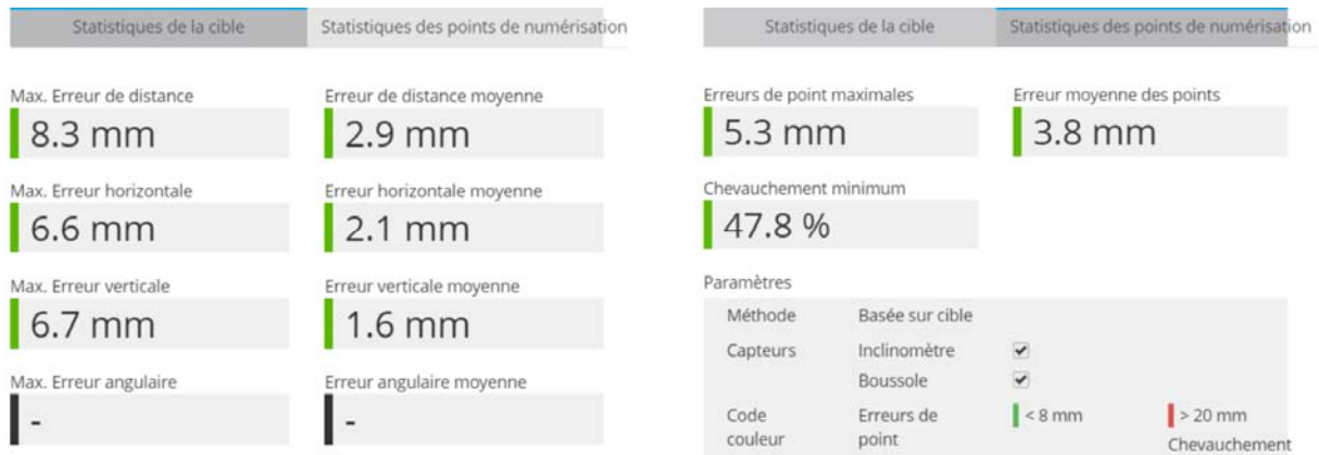
Figure 3 : Valeurs des erreurs d'assemblage des scans

Pour une parfaite information et une totale transparence, nous fournissons le rapport d'alignement détaillé en pièce jointe.