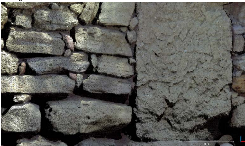
Figure 6 : Exemple de zone très lisible sur le nuage de points. Il s'agit d'une portion de mur à la limite nord de la zone.

Après ces divers traitements, le nuage de point est composé de 444 millions de points pour une surface d'environ 1200 m 2 (Figure 5). Si le nombre est grand, il ne décrit pas la densité ni la lisibilité des détails. En raison des paramètres utilisés lors de l'acquisition, on ne pourra utiliser le nuage de points pour des détails précis que dans les zones de proximités de la position du scanner lors des acquisitions. En effet, le faisceau du laser étant divergent, la densité de points diminue avec la distance au scanner. Si certaines zones particulièrement proches du scanner pourront être étudiées directement sur le nuage de points (Figure 6), la densité n'est pas homogène sur l'ensemble de la zone.