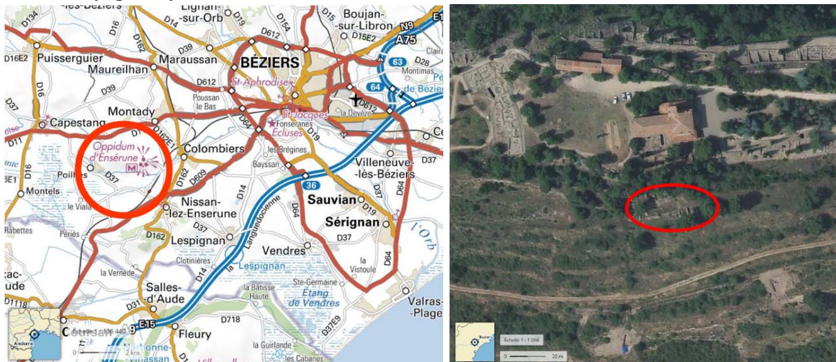
Figure 1 : Carte de situation de l'oppidum d'Ensérune.

L'oppidum d'Ensérune se situe à l'Ouest de Béziers à proximité de la commune de Nissan lez Ensérune (Figure 1).