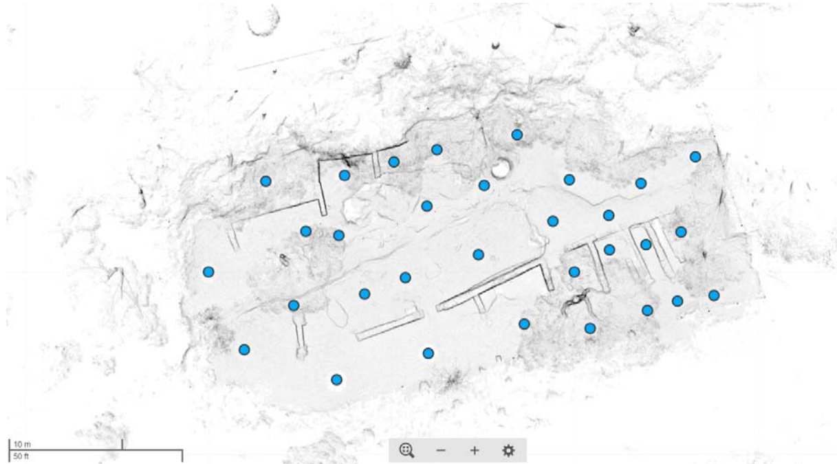
Figure 2 : Positions des scans sur le site de fouilles du secteur IV de l'oppidum d'Ensérune

L'assemblage des 31 nuages de points s'est fait avec le logiciel Faro SCENE. Il a été choisi de réaliser un assemblage par cible qui allie rapidité et précision. La Figure 2 montre l'emplacement des différents scans sur le site.