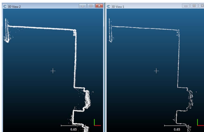
Figure 4 : Exemple de filtrage du bruit par CloudCompare.

Dans un premier temps, on élimine grossièrement à la main les points aberrants et ensuite on réalise un filtrage pour éliminer le "bruit". Cela consiste à supprimer les points isolés créés par rebond du signal sur un élément situé au premier plan de type feuille ou branche ou par mauvaise appréciation d'une bordure d'un objet ou d'un relief. Cette méthode de filtrage consiste à définir une limite autour du point et de calculer la distance qu'il a avec chacun de ses voisins dans la limite définie ainsi que la moyenne des distances et l'écart-type. A partir de ces valeurs, si un point est éloigné de plus de la distance moyenne + X écart-type (X est une valeur à donner), le point est considéré comme bruit et supprimé (Figure 4).