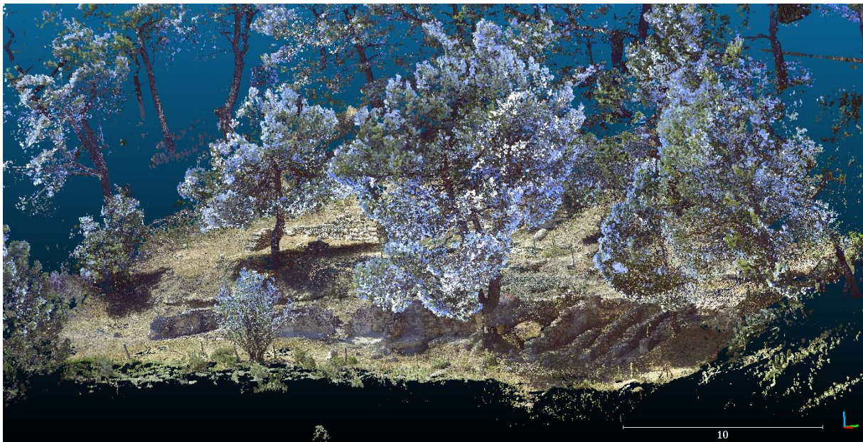
Figure 5 : le nuage de points couvrant la zone de fouilles