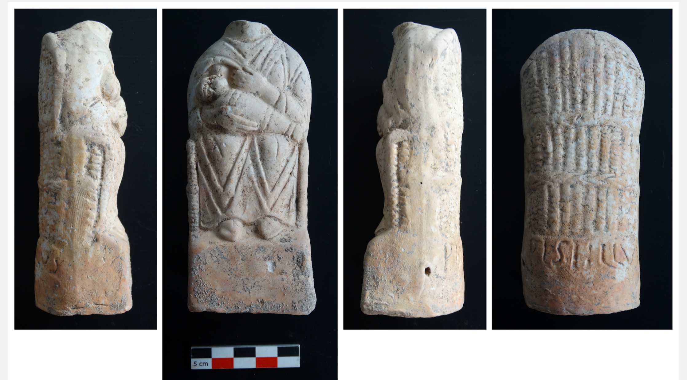
Fig. 4 : Figurine en terre cuite signée Pistillus.

En revanche, son abandon progressif entre la deuxième moitié du III e s. et le début du IV e s. ap. J.-C. est cohérent avec les données des autres sites qui montrent un abandon des sites ruraux entre le III e et le IV e s. à l'échelle de la vallée de la Bruche.