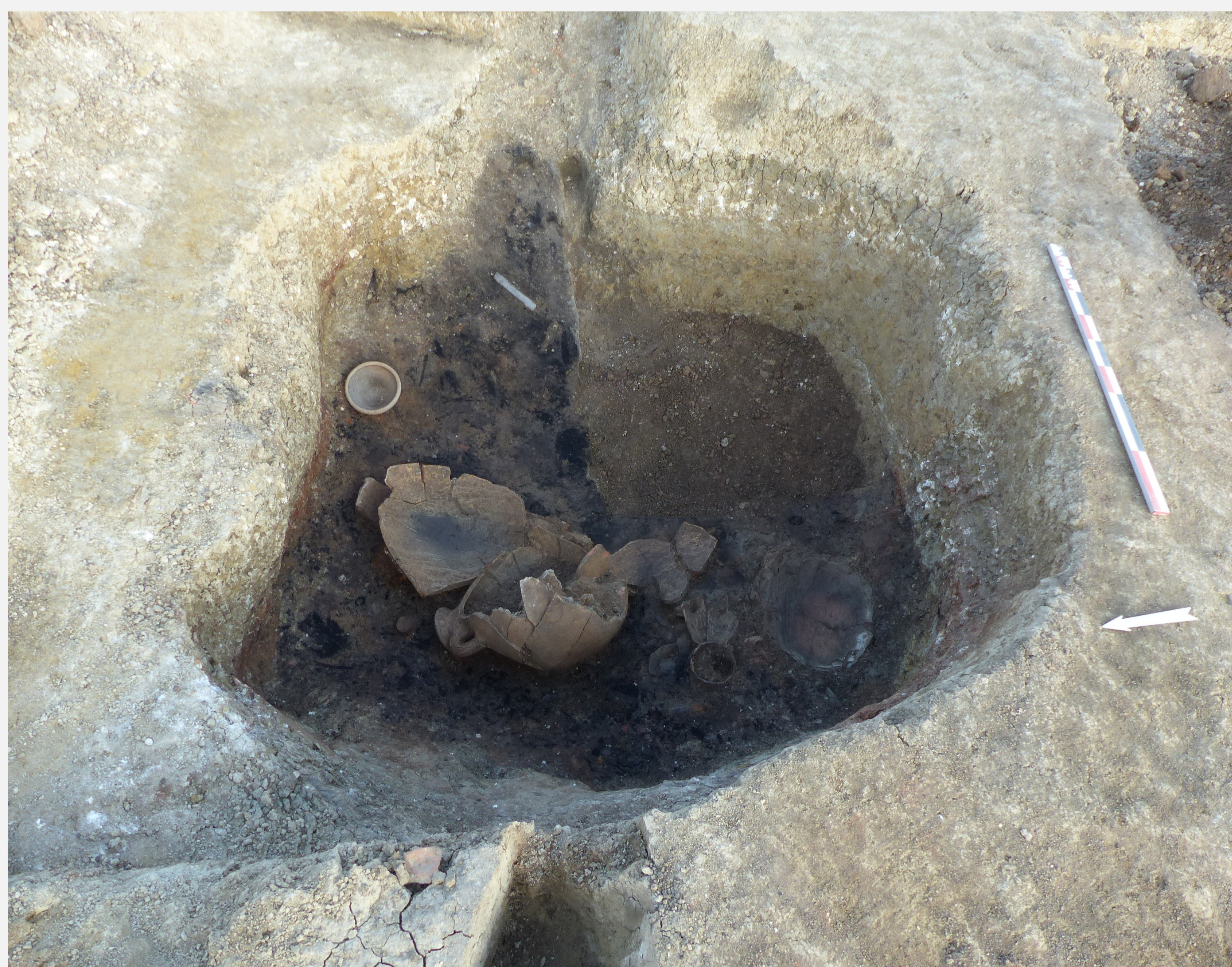
Fig. 2 : Niveau d'incendie dans la cave 3139.