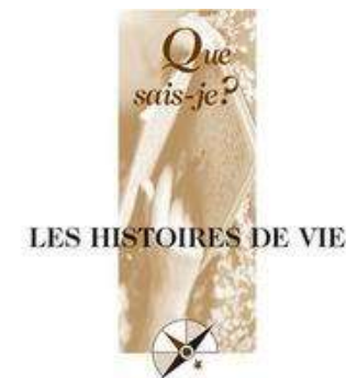
Gaston Pineau Jean-Louis Le Grand