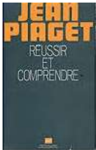
Piaget, J. (1974). Réussir et comprendre . Paris : PUF.

「成功するとは、私が提案した目標を達成するのに十分な程度に、与えられた状況において行動を理解することであり、理解するとは、行動で観察され、あるいは使われたつながりの理由と方法について、それらが提起する問題を解決できるところまで、同じ状況を思考することに成功することである。」（ピアジェ、1974年、231-232頁）