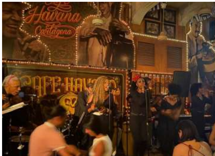
Fig. 12: Esibizione di un'orchestra salsera al Café Havana di Cartagena.