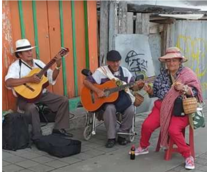
Fig. 9: musicisti ambulanti a Filandia.

secondo verso del ritornello 50 ) oppure possono costituire due blocchi/emistichi di uno stesso verso (i vari esempi si trovano a partire dalla prima strofa 51 ). La fisionomia melodica è molto orecchiabile, con un profilo maggiormente scorrevole nelle strofe (perché più lunghe ed articolate) e sinuoso nel ritornello (per la sua brevità e reiterazione) La tonalità è minore (spesso in la minore) e all'interno della melodia si possono cogliere dei prestiti dalla scala minore armonica, dati da una abbondante presenza dell'intervallo di seconda eccedente tra il VI e VII grado. Inoltre il brano è in tempo ternario che gli conferisce una certa ballabilità, nel pieno spirito del repertorio di parranda . Ciò che effettivamente divide le sezioni testuali sono gli assoli della prima chitarra 52 che propongono una melodia solistica come intermezzo tra strofe e ritornelli. Il tutto è sostenuto da un'armonia che ruota intorno ai tre fulcri principali: I-IV-V grado.