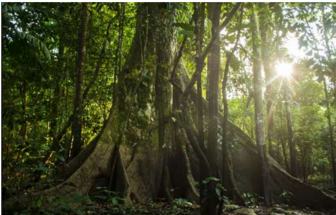
Fig. 2: Shihuahuaco, albero della foresta amazzonica.