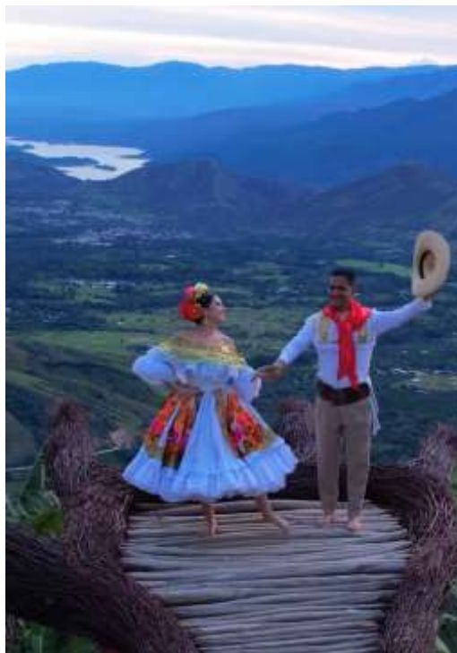
Fig. 6: ballerini di sanjuanero huilense in abiti tipici.