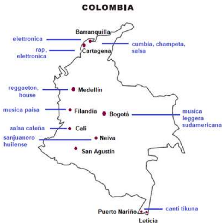
Fig. 13: cartografia di alcuni generi musicali incontrati in Colombia.