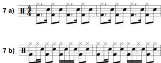
Fig. 7: due tipologie di ritmo del reggaeton (trascrizione per batteria).

La multidirezionalità 32 è ciò che caratterizza la storia del reggaeton sia per le sue origini che per la sua evoluzione, proprio per il fatto di essere nato da molteplici spunti musicali esistenti e di aver costruito la sua esistenza nutrendosi di ogni novità incontrata. All'interno della mescolanza musicale su cui si fonda è interessante notare il tratto tipicamente caraibico: la base ritmica del dembow . È probabilmente questo tratto che rende immediatamente riconoscibile il reggaeton, così come altri tipi di musica latino-americana, come la champeta colombiana, la dance hall giamaicana. Il ritmo in questione è dato da una scansione che può presentare alcune varianti, ne presentiamo quella base e un'altra più complessa (fig. 7).