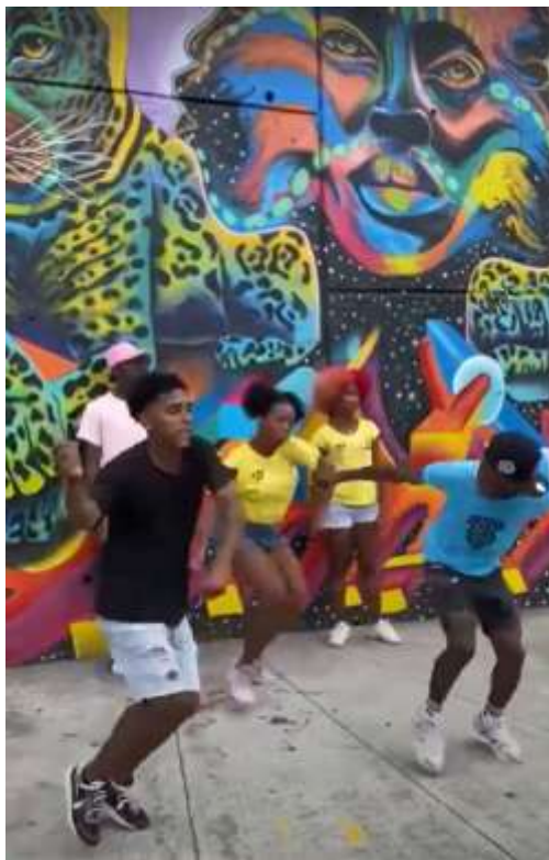
Fig. 8: ballerini di reggaeton, tra i murales della Comuna 13, Medellín. © Sabrina Piccolo Valerani