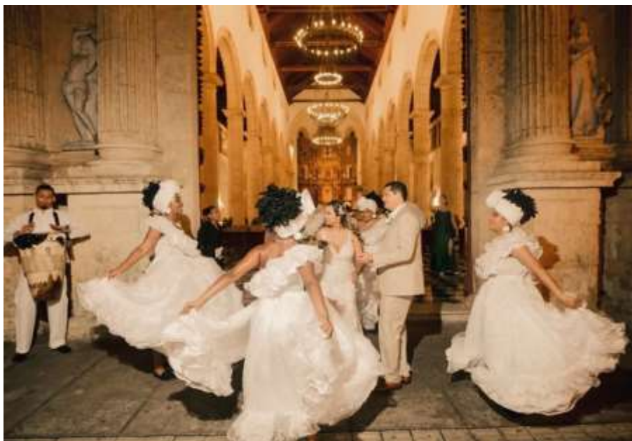
Fig. 10: ballerine di cumbia in un'esibizione per un matrimonio.

con cui si indicavano i neri di Guinea (Fernando Ortiz); cumbancha/kumba era termine che indicava le persone nobili dell'Africa Occidentale, particolarmente in Congo (Carlos Esteban Deive); Kumba-kumbé-kumbí erano le espressioni per connotare i tamburi (Nicolás Del Castillo Mathieu). Cfr. D'AMICO, L. «Cumbia Music in Colombia: Origins, Transformations and Evolution of a Coastal Music Genre» in L'HOESTE, H. F., VILA, P. (2013) [a cura di] Cumbia! Scenes of a Migrant Latin America Music Genre , Durham and London: Duke University Press, pp. 29-30.