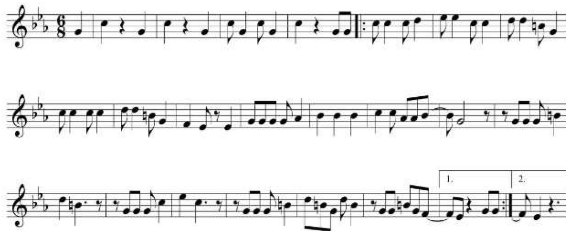
Fig. 5: frammento della melodia del Sanjuanero huilense di Anselmo Durán Plazas.

La coreografia dedicata a questa musica è interpretata da una coppia di ballerini che simulano, attraverso i movimenti di danza, il corteggiamento. Essi sono vestiti con abiti tipici, infatti la donna indossa una blusa su una gonna con delle vistose applicazioni floreali che si intonano ai fiori previsti per l'acconciatura. L'uomo indossa una camicia bianca, un pantalone spesso scuro, un cappello di paglia e un foulard rosso, funzionale alla messa in scena coreografica (fig. 6). I passi della danza sono organizzati in fasi, esattamente quelle che devono simulare le varie parti del corteggiamento 23 .