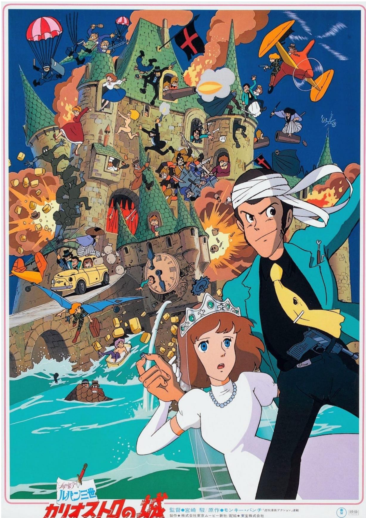
Figure 2 : Le Château de Cagliostro (ルパン三世 カリオストロの城, de Hayao Miyazaki 1979, affiche japonaise.

Avec l'aimable autorisation de Monkey Punch, TMS Entertainment Co. Ltd. Futabasha Publishers Ltd.