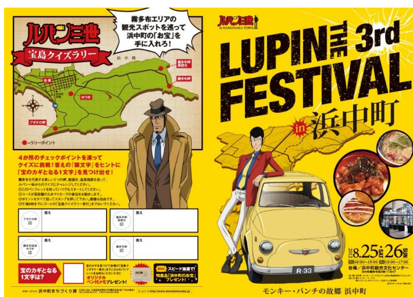
Figure 5 : Touristification ( mise en tourisme = mise en scène, mise en récit, mise en image d'un territoire ) Monkey Punch festival à Hamanaka : entre cartographie imaginaire et réelle du plan d'une ville littorale.– feuillet du festival de 2012.