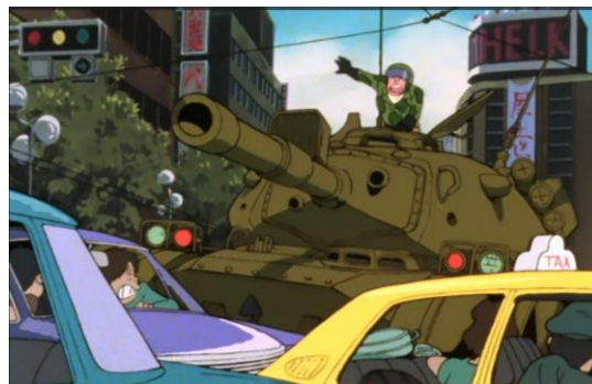
Tokyo, un champ de bataille pour les militaires Japonais