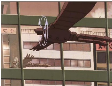
LAMBDA, le robot