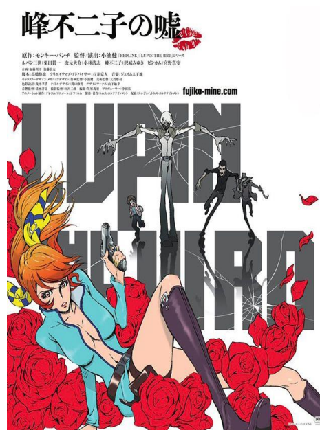
Figure 3 et 4 : Mine Fujiko dans Lupin III le Secret de Mamo , 1978 et pour la série éponyme de 2012 à 2019, ici Lupin III : Une femme nommée Fujiko Mine (LUPIN the Third ~峰不二子という女~), 2019 Partie 1 et 2, Telecom Animation Film, Nippon TV. Par Sayo Yamamoto et principalement Takeshi Koike chara-design. Une série adulte portant son nom.