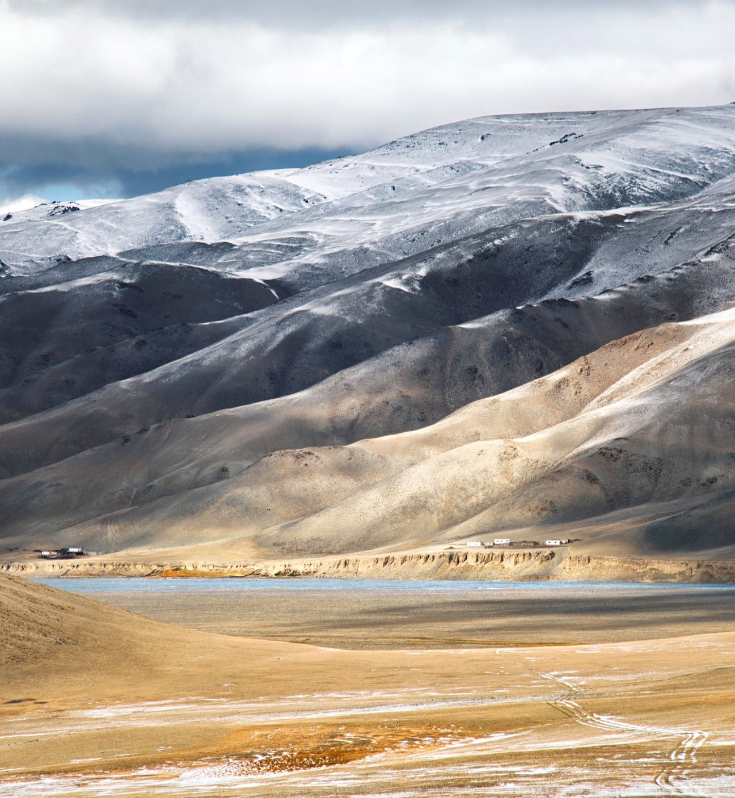
Paysage de la Mongolie actuelle. Lors du dernier maximum glaciaire (23 000 ans avant le présent), Homo sapiens évolue dans un environnement comparable à ces steppes glacées.