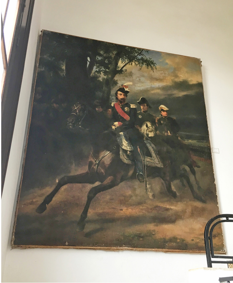
3 Horace Vernet, Portrait du Prince Louis Napoléon à la revue de Satory , 1851, huile sur toile, musée national des Beaux-Arts d'Alger, photographie de l'auteure, février 2018

La revendication des tableaux ne vient pas des musulmans algériens, assez indifférents en matière d'art, [...] ces toiles dont la plupart sont plutôt propres à heurter le caractère musulman. 31 »