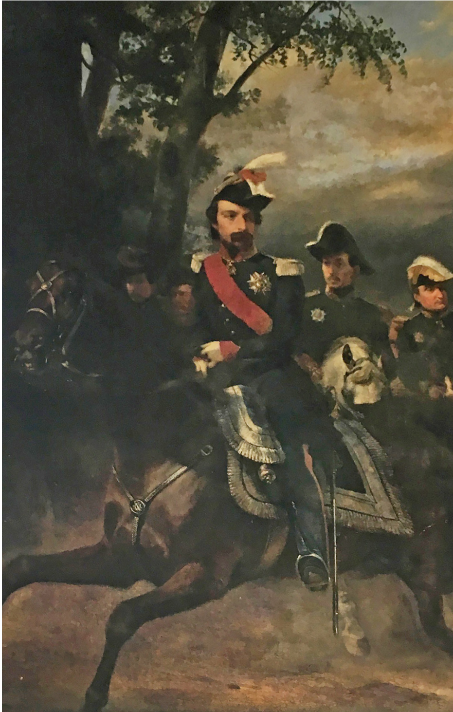
Horace Vernet, Portrait du Prince Louis Napoléon à la revue de Satory , 1851, huile sur toile, musée national des Beaux-Arts d'Alger, photographie de l'auteur, février 2018 (détail de la fig. 3, page 98)