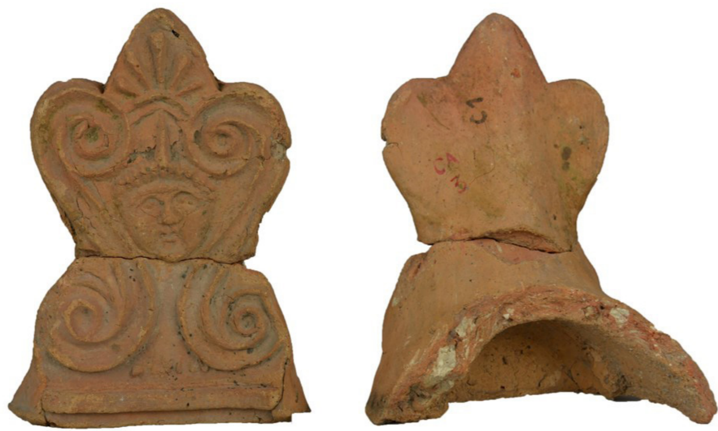
Antéfixe découverte à Autun (Saône-et-Loire)