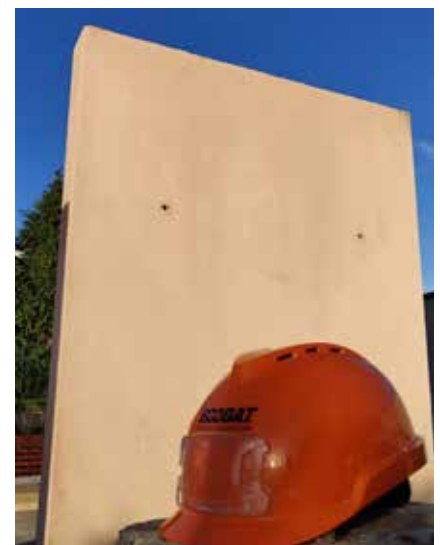
Mur prototype en BARBE à l'échelle 1

La première étape a été de trouver un gisement de terre pour ce matériau. Dès le départ, le choix a été de ne pas utiliser des terres excavées, mais de prendre des fines de lavage de carrière,