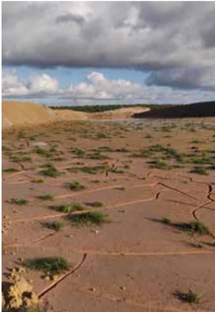
Bassin de décantation où sont stockées les fines de lavage de carrière

qui sont des déchets de la production de granulats et qui comportent une fraction argileuse conséquente (phase liante de la terre crue). Aujourd'hui, cette matière première ultra-abondante n'est pas revalorisée. De plus, les caractérisations menées en laboratoire ont démontré une homogénéité dans le temps du gisement étudié.