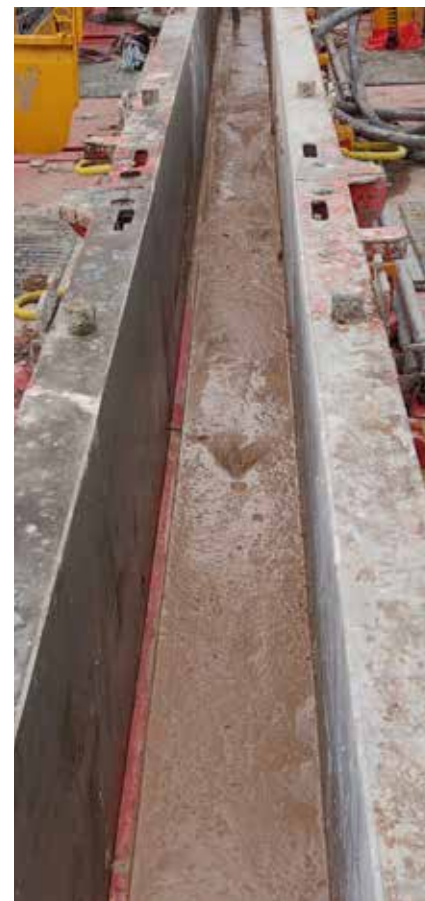
Coulage d'un mur en BARBE dans les banches et mise en place à l'aiguille vibrante

L'objectif d'industrialisation restera le point de mire de toutes ces études. Différents modes constructifs, autres que