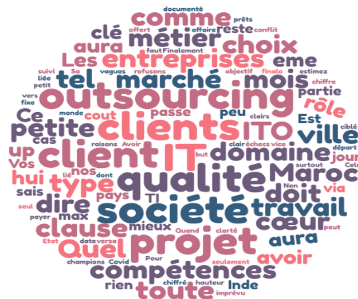
Figure 2 : Nuage de mots issu des données de l'entretien

Nous avons également mené une analyse lexicale pour déterminer la fréquence des mots apparus dans l'entretien.