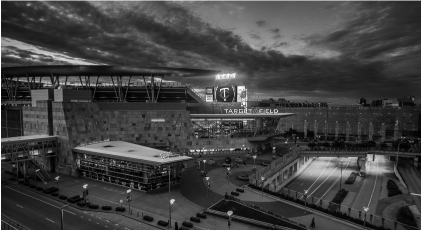
Figure 3: Prince, une image, une couleur, une ville, un stade, un lit up.

créative de Minneapolis, des initiatives foisonnent, parmi lesquelles la présence du chanteur Prince comme point intégrateur de l'image de la ville et de sa capacité à innover. 20 Depuis sa mort, on remarque une stratégie marketing et de communication commune à Paisley Park et à la municipalité pour intégrer la vie du chanteur dans des circuits touristiques où son studio de musique et musée jouent un rôle majeur, mais aussi les traces que Purple Rain a laissées dans la mémoire de la ville. Un mur digital et physique en la mémoire du chanteur est mentionné par le site de l'office de tourisme. Une expérience Prince est proposée, sans que cette dernière ne tombe dans une dévotion ou récupération maladroite. 21