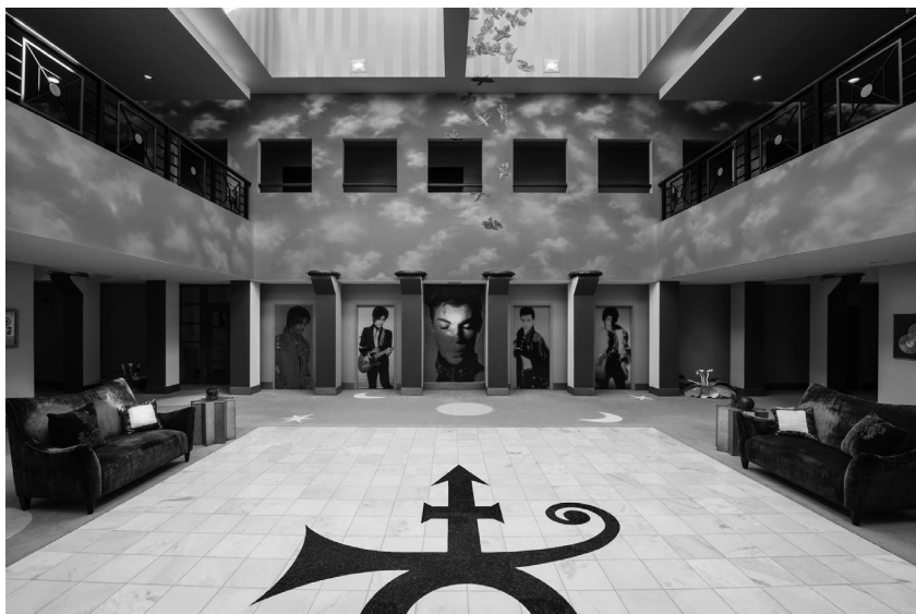
Figure 4: Paisley Park, hall d'entrée. IIP Photo Archive. Paisley Park – Courtesy of Meet Minneapolis, 2017.