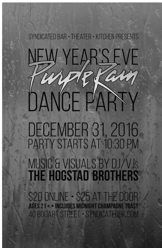
Figure 2: Prince, Purple Rain dans la mémoire collective, affiche d'un bar, 2016.

controversées. 12 Le projet débute en novembre 1983, financé par Steven Fargnoli, et sort en salles le 27 juillet 1984, rapportant 71 millions de dollars. Quant à sa bande-son, elle se vend dans les années qui suivent à plus de vingt millions d'exemplaires, dont quatorze millions pour les seuls États-Unis, et reçoit l'Oscar de la meilleure chanson de film pour le morceau-titre. When Doves Cry , Let's Go Crazy , Purple Rain deviennent des références avec une tournée où 1,7 million de billets sont vendus. Pour l'artiste, la conception de film et de bande originale de film devient un moyen de superposer musique, cinéma et une tournée pour s'ouvrir à un plus large public et conforter une identification à la couleur pourpre [Figure 2].