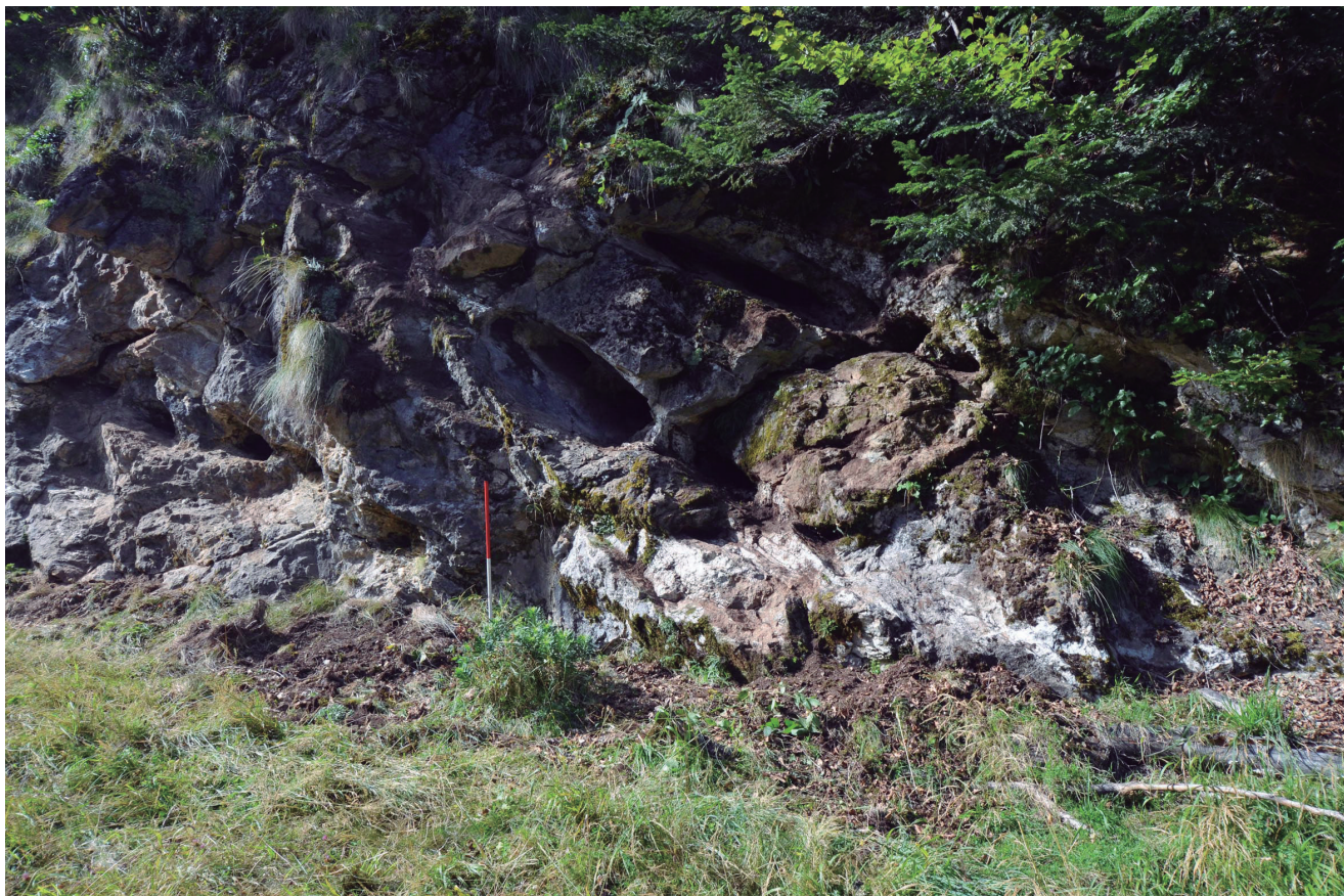
Fig. 2. Grattages sur filon de quartz près du col de l'Estrade (Saint-Lary, Ariège).