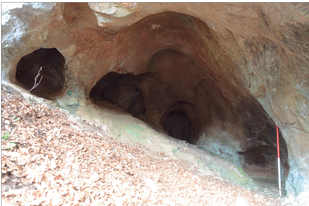
Fig. 3. La mine de Souleilha à Saint-Lary (Ariège).