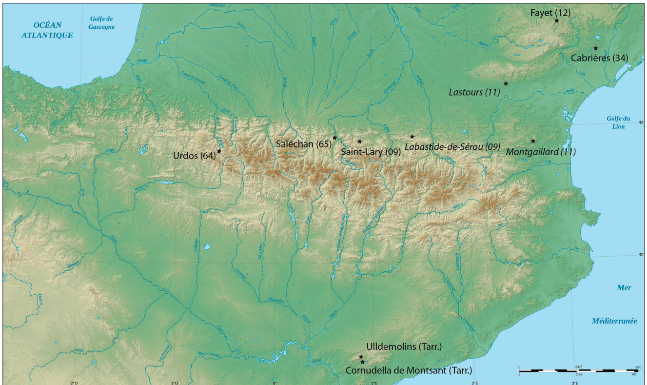
Fig. 4. Carte des gisements de cuivre exploités du Néolithique à l'âge du Fer dans les Pyrénées et à proximité (DAO J.-M. Fabre).

les Alpes, le Massif central et les zones d'exploitation connues dans le nord de l'Espagne, dans la région du Priorat 17 et dans la Cordillère cantabrique 18 .