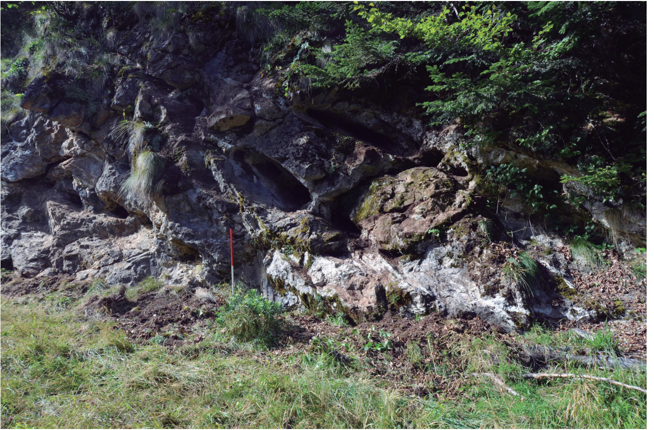
Fig. 2. Grattages sur filon de quartz près du col de l'Estrade (Saint-Lary, Ariège).