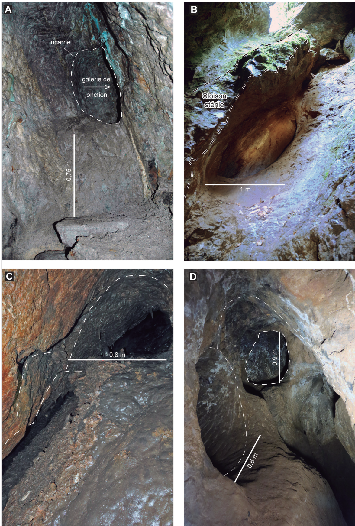
Fig. 2. Exemples de chantiers ouverts au feu ou à l'outil. A. Les Atiels, chantier inférieur ouvert à l'outil et lucarne d'accès à la galerie de jonction. B. La Coustalade, chantier incliné ouvert au feu et vestige de cloison interne stérile. C. Rougé, niveau -26 ouvert au feu et négatifs des étages successifs. D. Le Goutil Est, travaux ouverts au feu et à l'outil dans le même secteur..