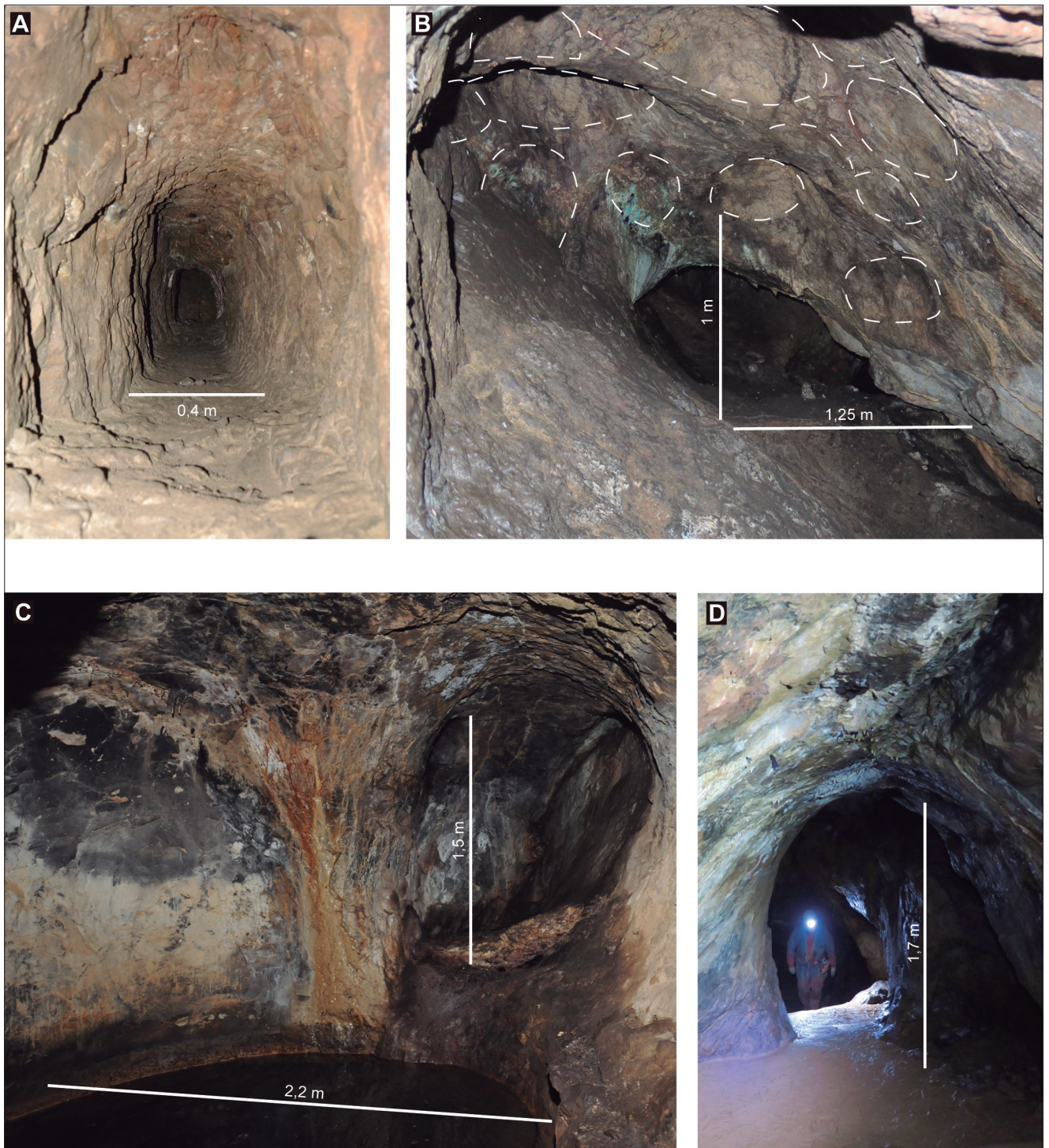
Fig. 4. Différents volumes de creusements. A. Le Goutil Ouest, galerie de jonction de taille très réduite.

B. Rougé, chantier large composé de plusieurs coupoles individuelles. C. Hautech9, grandes coupoles uniformes des étages profonds.