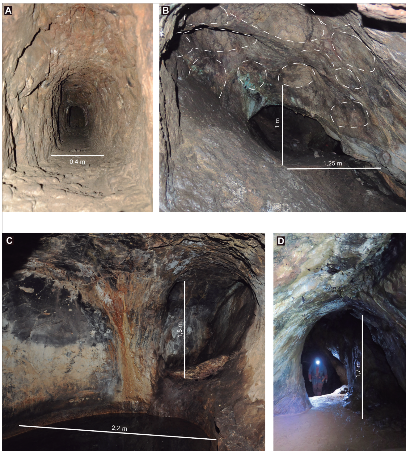
Fig. 4. Différents volumes de creusements. A. Le Goutil Ouest, galerie de jonction de taille très réduite.

B. Rougé, chantier large composé de plusieurs coupoles individuelles. C. Hautech9, grandes coupoles uniformes des étages profonds.