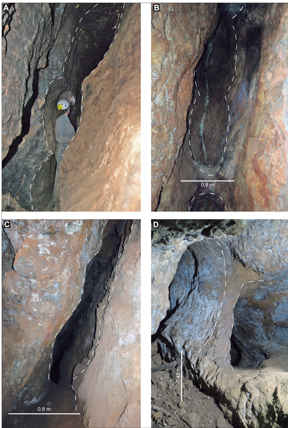
Fig. 3. Niveaux d'exploitation étagés. A. Le Goutil Ouest, trois étages ouverts au feu. B. Hautech5, étages ouverts au feu avec reliquat de plancher dans la partie basse. C. La Coustalade, étages ouverts au feu. D. Le Goutil Est, étages superposés ouverts au feu et à l'outil, remblayés à la base.