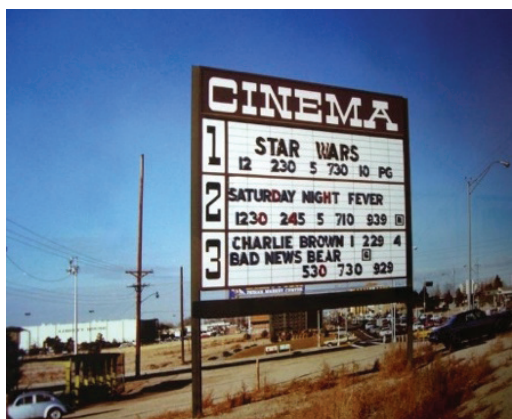
Foto 11. Cinema “Le Saturne” em Togliatti, na Rússia, em 2007.