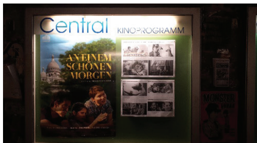
Foto 6. Programação do filme francês "Um beau matin" em Berlim, janeiro de 2023.