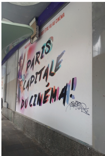
Foto 1. Cartaz do cinema “L’Arlequin”, Paris, rue de Rennes, 16 de julho de 2021.