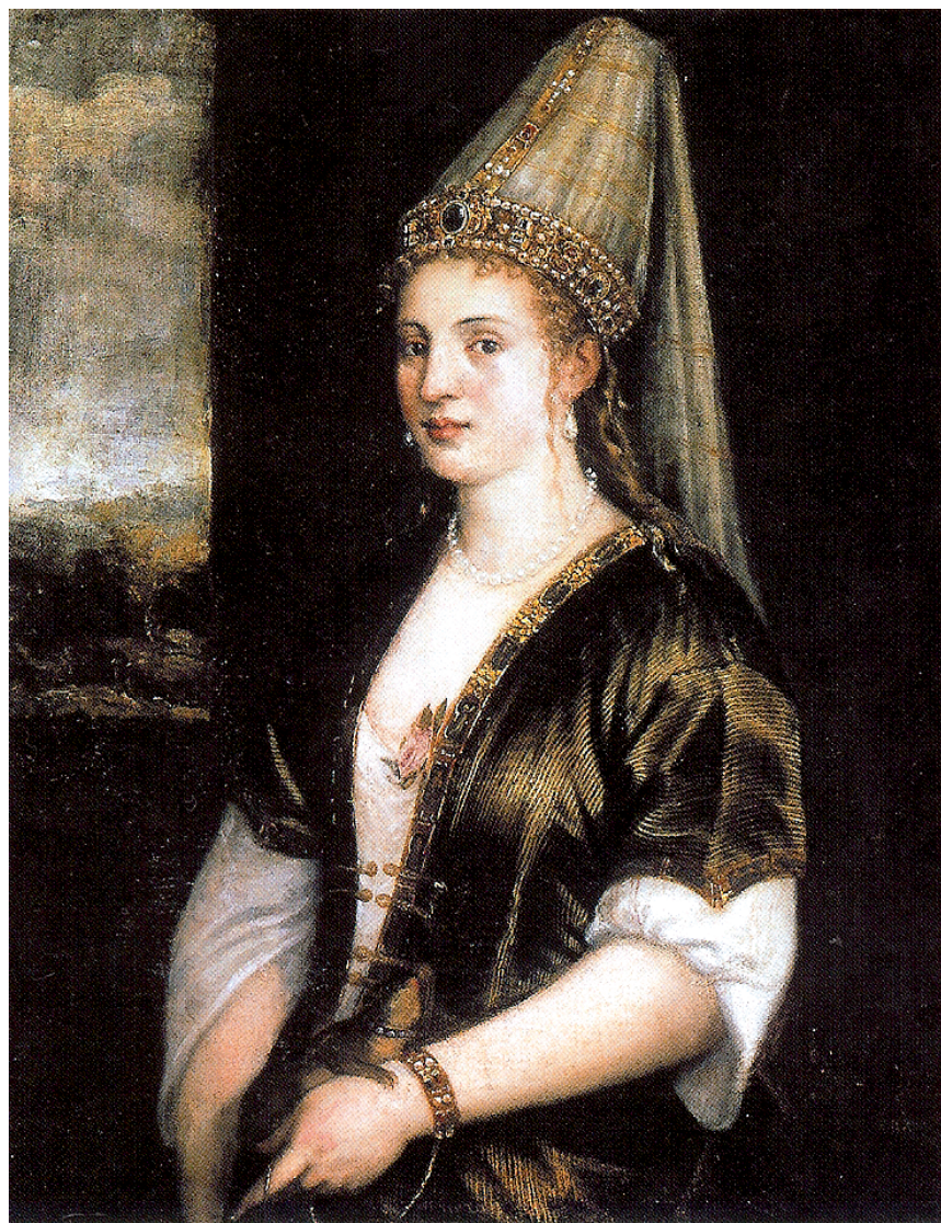
Figure 8. — Atelier du TITIEN, La sultane Rossa , huile sur toile, 96,5 × 76,2 cm, Sarasota, John Rigling Museum.