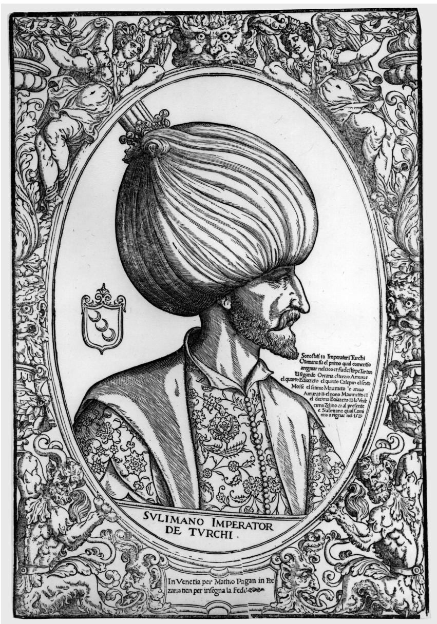
Figure 3. — Agostino VENEZIANO, Sulimano Imperator de Turchi («Soliman, Empereur des Turcs»), gravure sur bois, 51,8 × 35,9 cm, Venise, «pour Matheo Pagan».