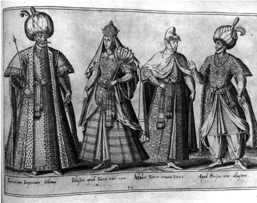
Figure 15. — Abraham DE BRUYN, Illustris apud Turcos viri uxor , dans [id.], Omnium pene Europae, Asiae, Africae atque Americae gentium habitus , s.l., s.n. [Joss de Bosscher], [1581], oblong, 72 pl., pl. 50, fol. [47 r.].

tale, Catherine d'Alexandrie (fig. 9, p. 319), appuyée sur l'un des instruments de son martyre, type repris et modulé dans plusieurs copies ou variantes subsistantes. Celle du Schlossmuseum d'Aschaffenburg 1 comme celle présente dans une collection privée anglaise 2 ou encore la copie xix e de la vente Sotheby's 3 sont restées fidèles au modèle dans l'attitude du personnage à l'exception toutefois de l'instrument du martyre, non figuré. Dès lors, ces versions devenaient autant de portraits de