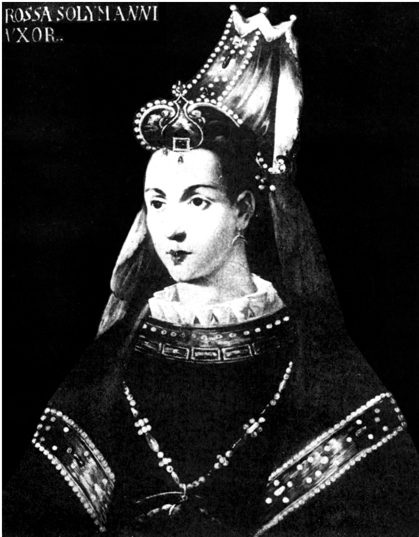
Figure 7. — Anonyme, ROSSA SOLYMANNI VXOR (« Rossa, épouse de Soliman »), huile sur bois, Istanbul, Palais de Topkapı.