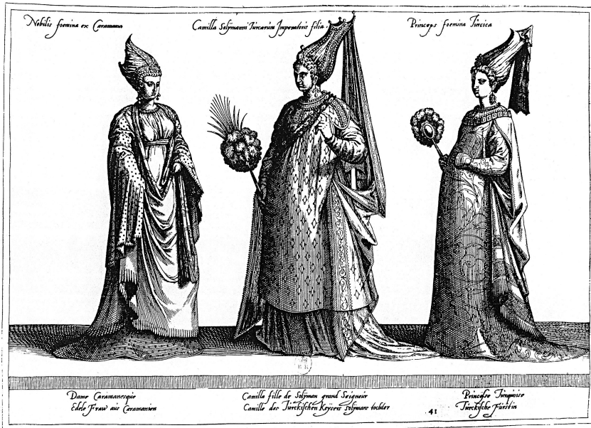
Figure 16. — A. DE BRUYN, Jean-Jacques BOISSARD, Camilla fille de Solyman grand Seigneur (Dame de Caramanie — Princesse Turquoise) , dans [id.], Habitus variarum orbis gentium. Habitz de nations estranges. Trachten mancherley Völcker des Erdsckreytz , s.l., s.n., 1581, oblong, 61 pl., pl. 41.

Camera, comme la copie présente dans les collections de l'Accademia Carrara de Bergame (fig. 10 1 , p. 320), conçue indépendamment puisque l'attitude du personnage diffère légèrement et que ses deux mains sont ici figurées.