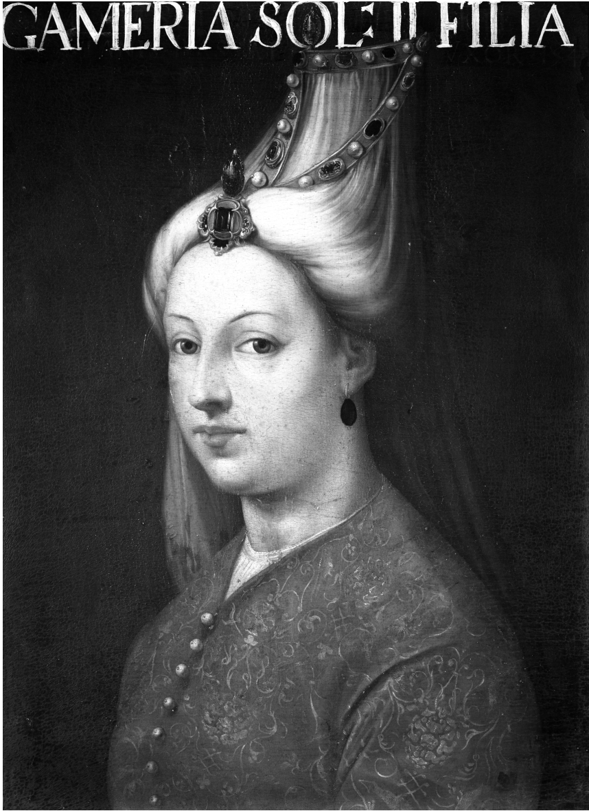
Figure 5. — Cristofano DELL'ALTISSIMO, GAMERIA SOL : [IMANI] FILIA (« Gamera ( sic ), fille de Soliman »), huile sur toile, Florence, Galerie des Offices.