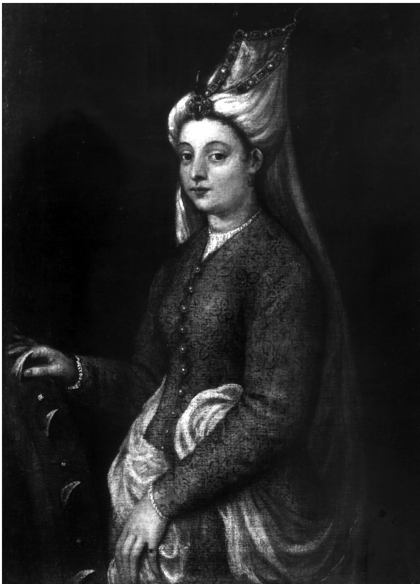
Figure 9. — Atelier du TITIEN, Camera en sainte Catherine , huile sur toile, 99,3 × 71,5 cm, Londres, Courtauld Institute of Art Gallery.