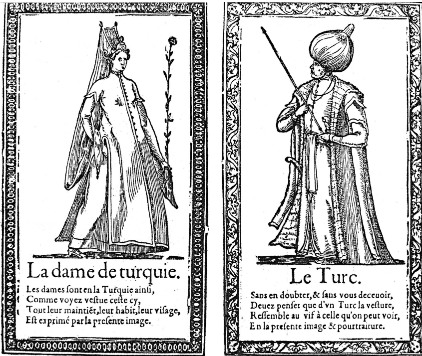
Figure 13. — Anonyme, La dame de turquie , gravure sur bois, dans François DESERPZ [DESPREZ], Recueil de la diversité des habits [...] , Paris, Richard Breton, 1567, fol. [62 v.]-[63 r.].

Malgré cette grande parenté iconographique entre mère et fille, les contemporains pouvaient jouer de leur différenciation (l'aspect juvénile, le voile de la coiffe masquant toute la chevelure); aussi, de la même façon que le type de Roxelane devint celui de la sultane, celui de Cameria se perpétua-t-il sous une forme pour le moins originale pour celle qui incita, semble-t-il, Soliman, son père, à entreprendre la guerre sainte par la conquête de Malte 1 . D'un probable premier tableau original du Titien, daté d'environ 1552 et depuis perdu, fut réalisée (sans doute vers 1555 2 ) cette adaptation faisant de Cameria une sainte orien-