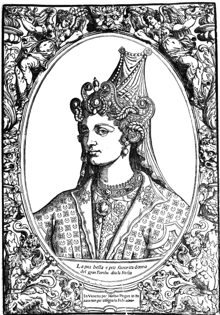
Figure 4. — Agostino VENEZIANO, [Hürrem] La piu bella e piu favorita donna del gran Turcho dita la Rossa , gravure sur bois, 51,6 × 35,9 cm, Venise, « pour Mattheo Pagan ».