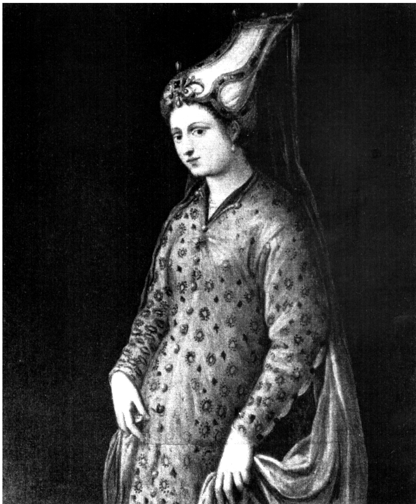
Figure 10. — École du TITIEN ?, atelier de TINTORET ?, Cameria , huile sur toile, 112 × 94 cm, Bergame, Accademia Carrara.