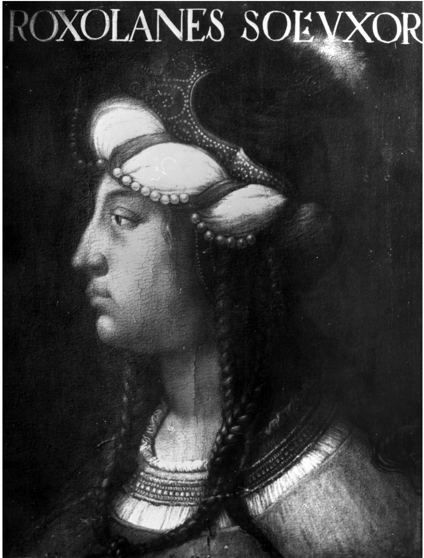
Figure 2. — Cristofano DELL'ALTISSIMO, ROXOLANES SOL : [IMANI] VXOR (« Roxelane, épouse de Soliman »), huile sur toile, Florence, Galerie des Offices.