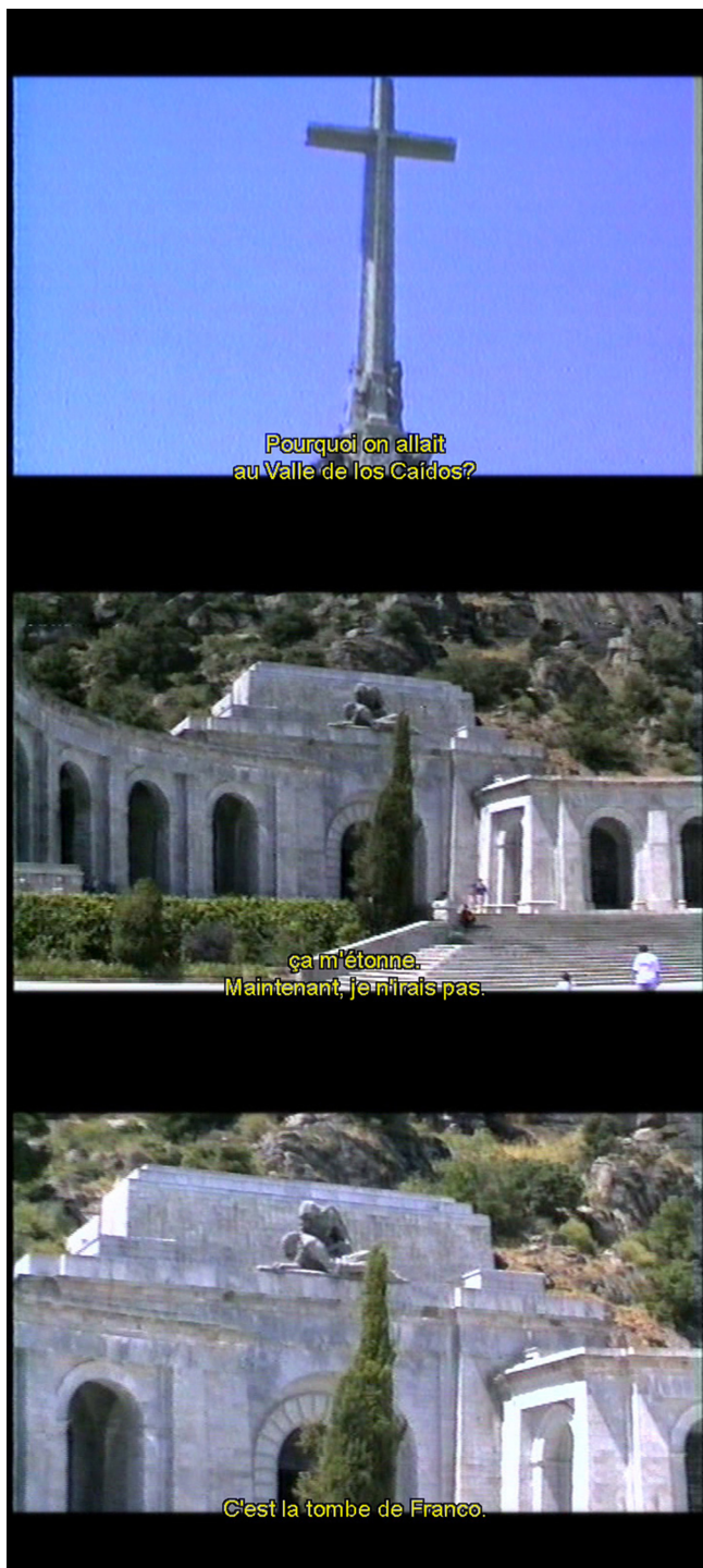
El Valle de los Caídos dans Hacienda Memoria (Sandra Ruesga, 2005).