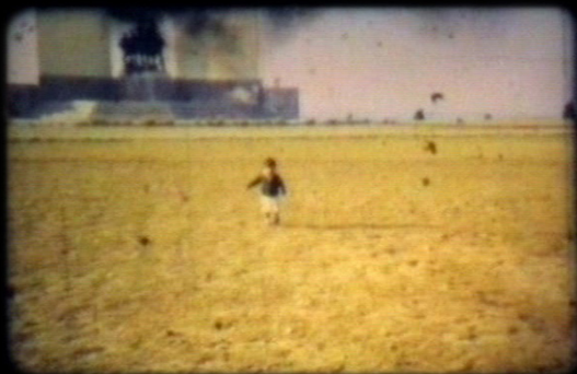
El Cerro de San Cristóbal dans Hacienda Memoria (Sandra Ruesga, 2005).

Je l'ai filmé au ralenti, et tu courrais,