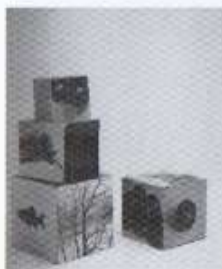
Marcel Broodthaers, Fotografie-Würfel , 1974-75, photographies sur carton, dimensions variables, Catalogue Marcel Broodthaers, Museum Ludwig, Cologne, 1980, p. 46.

de ces structures métalliques qui serviraient de structures d'accueil pour des images. Il décida de ne plus opter pour le système de boîtes ou caissons pour la présentation de ses photographies. Il existe pourtant une histoire de cette mise en relation entre la photographie et la sculpture. Une des œuvres les plus importantes, des plus méconnues et des plus émouvantes est celle de Marcel Broodthaers, une pièce de 1974-75, intitulée Fotografie-Würfel , que l'on peut traduire par cube photographique ou bien encore Dé-photographique, cette dernière traduction est plus satisfaisante et correspond mieux à l'idée de la pièce de Broodthaers. Cette œuvre de Broodthaers est parmi les dernières de l'artiste. Fotografie-Würfel est un ensemble de quatre cubes dont les faces sont des images photographiques en noir et blanc. 1 Sur ces images figurent un poisson, des tomates, un arbre, une boule, cela ressemble à s'y méprendre à un jeu de cubes pour enfants où chaque face d'un cube est une portion d'image à assembler.