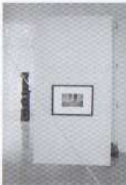
Rachel Harrison, Snake in the Grass, 1997/2009, photographies, panneaux de bois, cordes, polystyrène, dimensions variables.

Rappelons que cette phrase est issue du texte pour l'exposition Mémoires d'aveugle, L'autoportrait et autres ruines . Et si ces pièces étaient des autoportraits ? Et si elles étaient qui plus est des autoportraits en ruine, pour reprendre Derrida. Mais pour le philosophe le terme d'anticipation sert à aborder le « voir venir » de Catherine Malabou. « Le « voir venir » désignera de ce fait le jeu conjugué de la nécessité téléologique et de la surprise dans la philosophie hégélienne ». 3