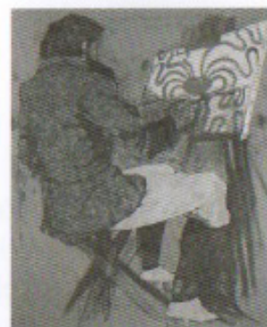
Jean Le Gac, La vocation , 1990, technique mixte sur toile et texte encadré, 50 x 60 cm et 240 x 189 cm

avec la perspective qu'il respecte par endroits des tableaux, mais qu'il relève dans d'autres parties. De plus en plus de coupes franches surgissent donnant un rythme à la composition, ce qui n'était pas encore présent. Il est évident qu'il arrive ainsi à maturité, il assume désormais pleinement des références aussi diverses et variées que Immendorf, Hockney, Rauch, Buttner. Il assume aussi les notions de bricolage et de collage qu'il manie avec plus de dextérité. Il mêle aujourd'hui avec plaisir des images issues des archives familiales, à celles issues de la culture populaire (les illustrations de Michel Gourdon au fleuve noir, les couvertures de revues de science-fiction comme Météor , Cosmos ou Galaxie ). Pour la résidence à Immanence, il a entamé un triptyque de la maison familiale pensé comme une multiplicité de scènes. Dans cette toile, une composition de presque trois mètres de long sur un mètre trente de haut, Lecomte nous livre et délivre, non pas sa vision des choses, mais une proposition. Il a réussi à libérer son