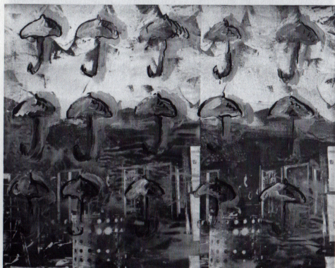
Paul Thek/Marcel Duchamp, Umbrellas. 2012, acrylique sur papier, 40 x 50 cm