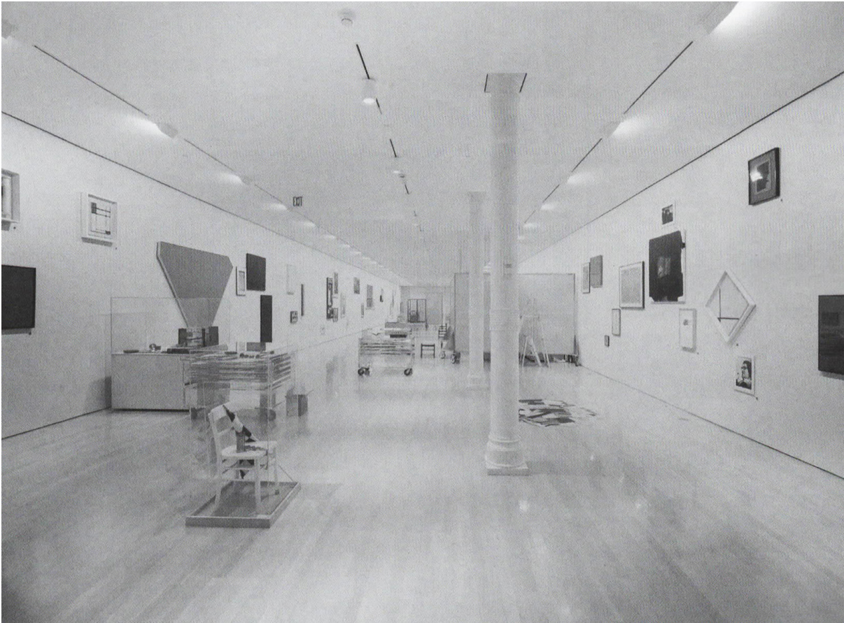
Vue de l'exposition, Guggenheim Museum Soho, New York, 1994.