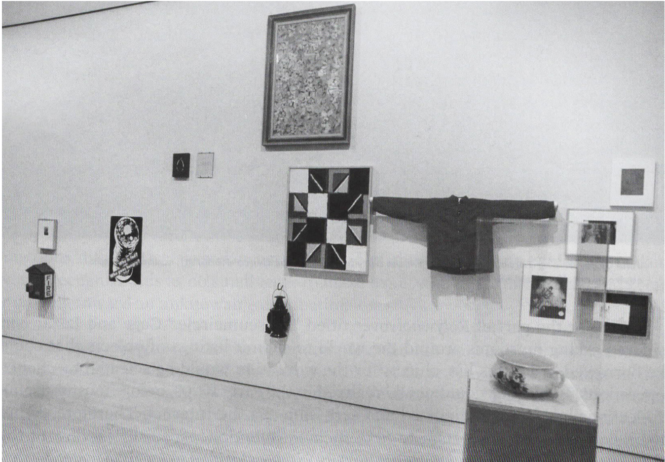
Vue de l'exposition, Guggenheim Museum Soho, New York, 1994.