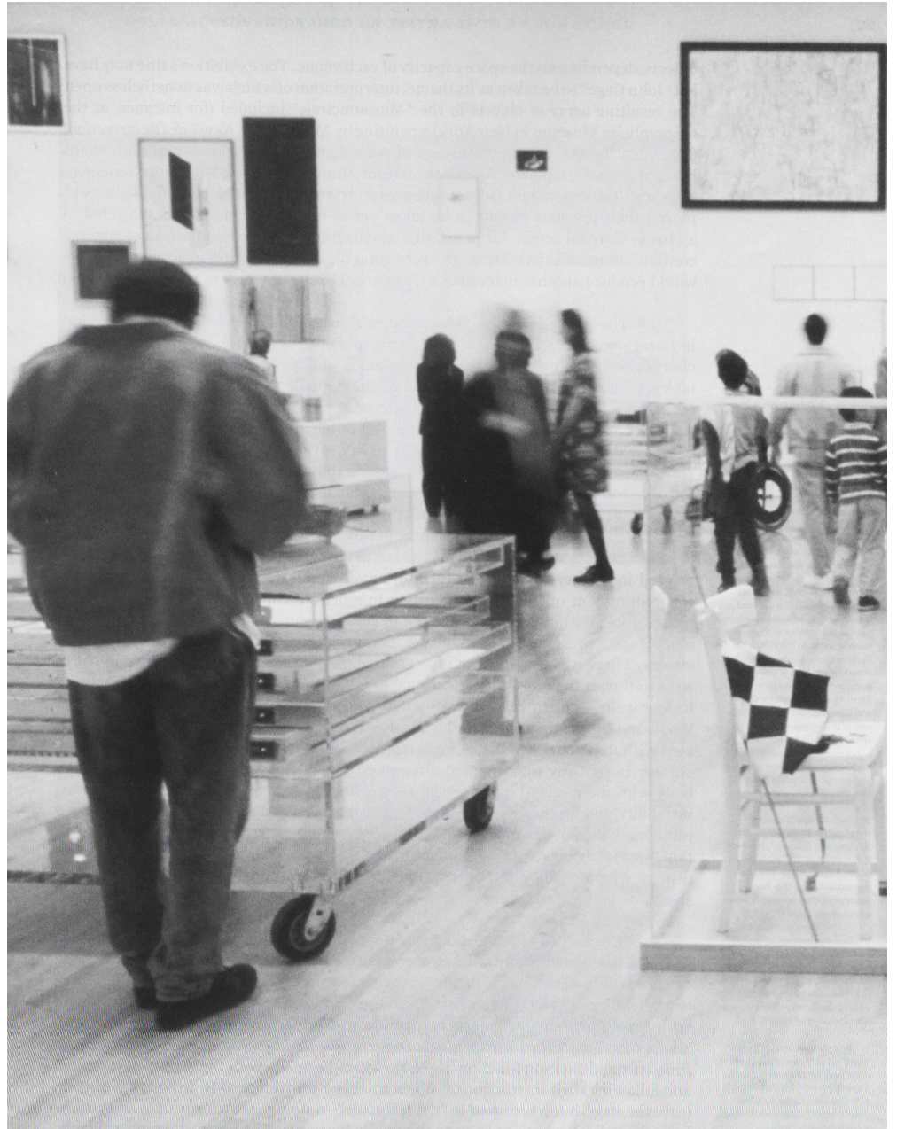
Vue de la salle Circus, LA MoCA, 1993