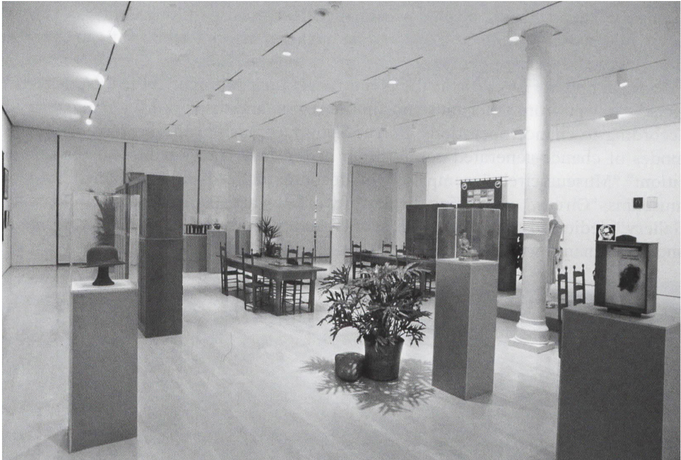
Rolywholyover, Vue de l'exposition, Guggenheim Museum Soho, 1994.