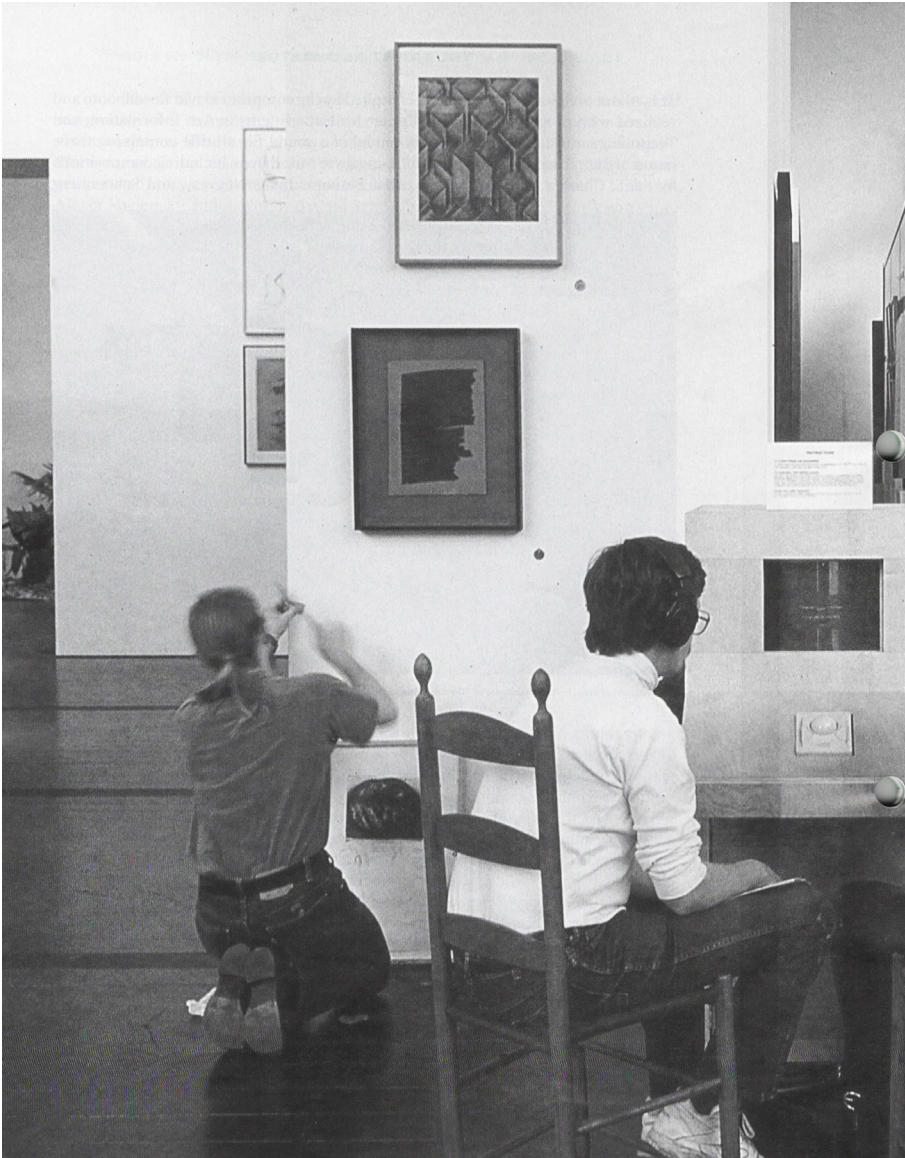
Montage de l'exposition Rolywholyover, The Menil Collection, Houston, 1994