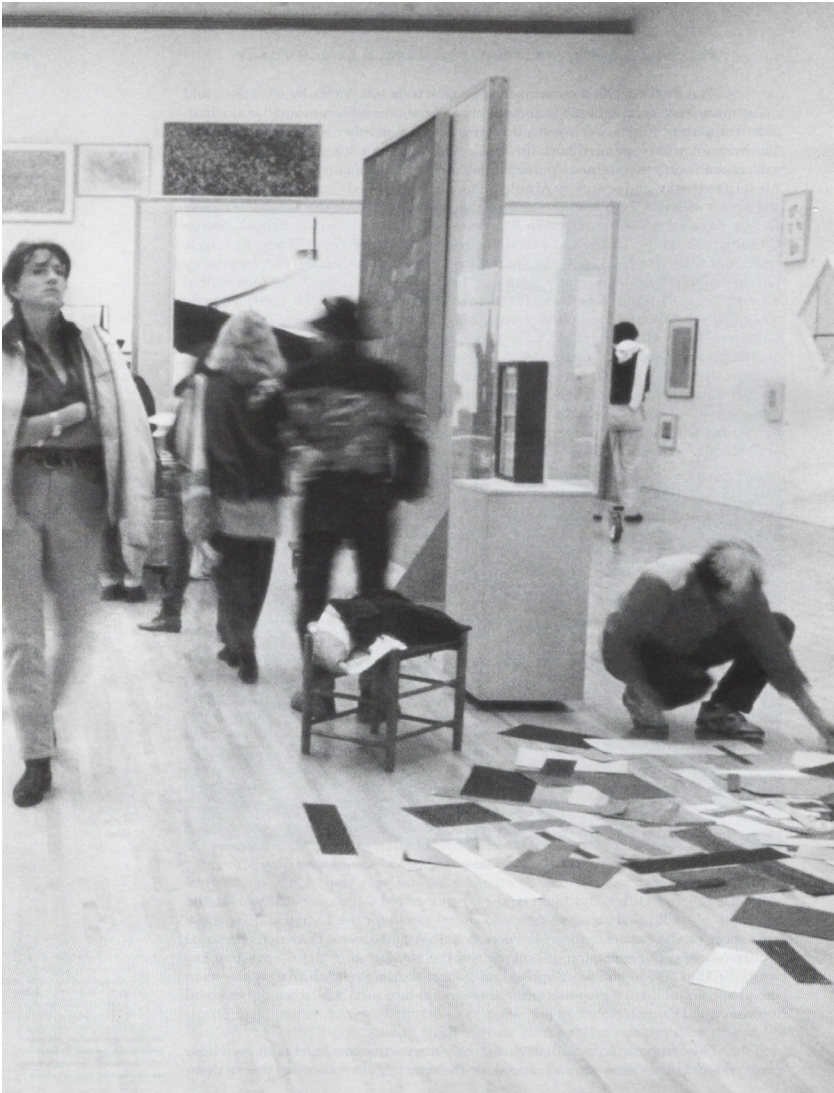
Vue de la salle Circus, LA MoCA, 1993