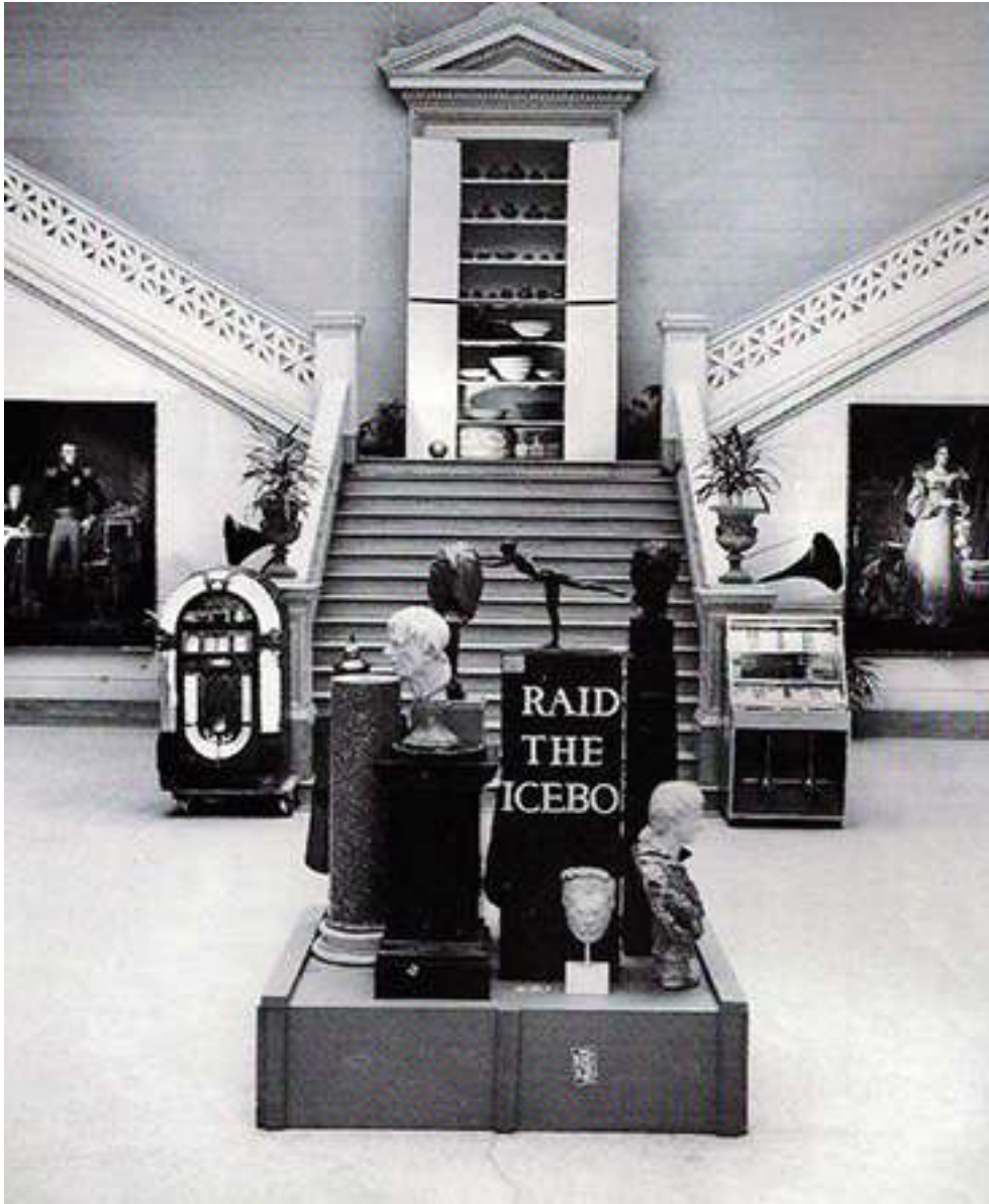
Vue de l'exposition Raid the Icebox 1 with Andy Warhol au Isaac Delgado Mu- seum, New Orleans, 1970.