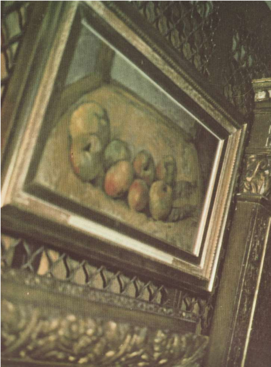
Andy Warhol, Sans titre (Cézanne), 1969.