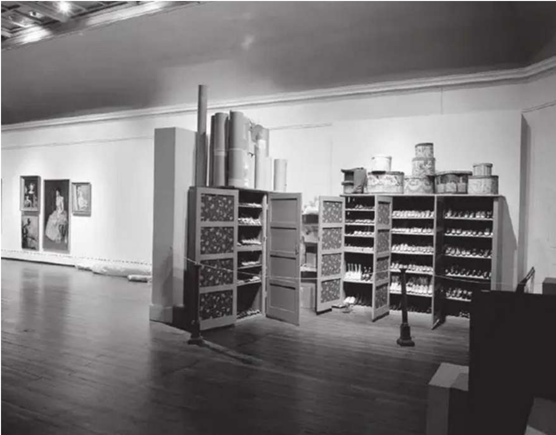
Raid the Icebox 1 with Andy Warhol, vue de l'exposition au Museum of Art, Rhode Island School of Design.