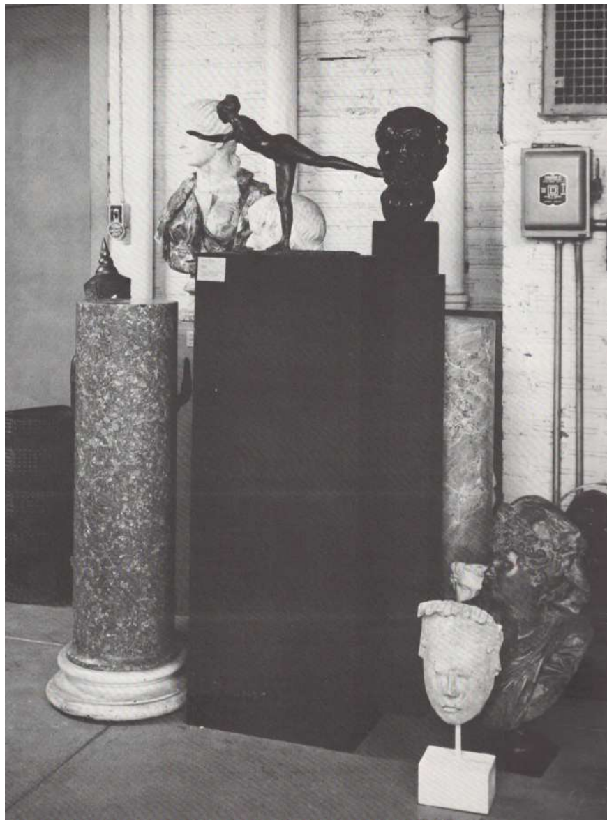
Sculptures dans les réserves.