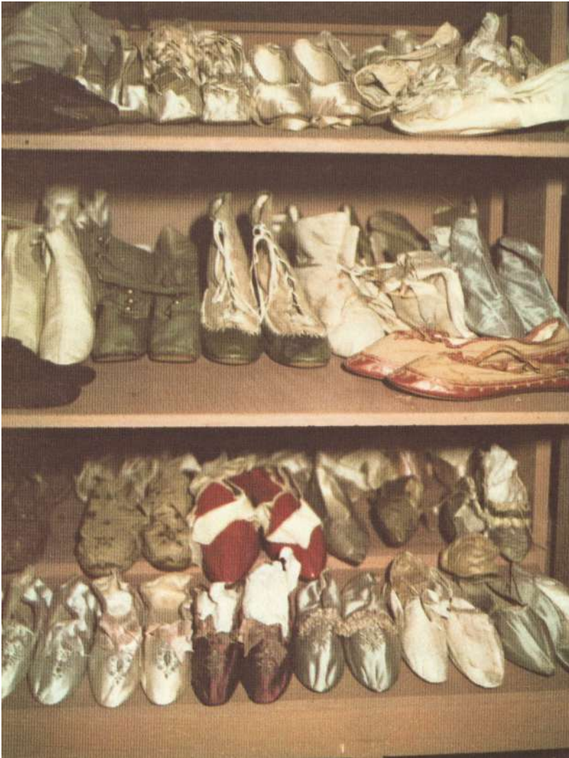
Andy Warhol, Sans titre (Trois étagères de chaussures), 1969.