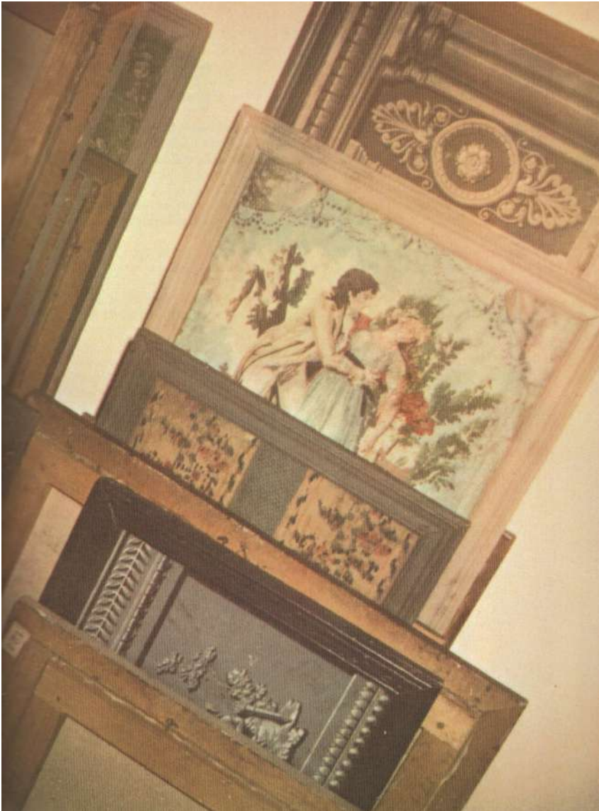
Andy Warhol, Sans titre (Papiers peints français), 1969.