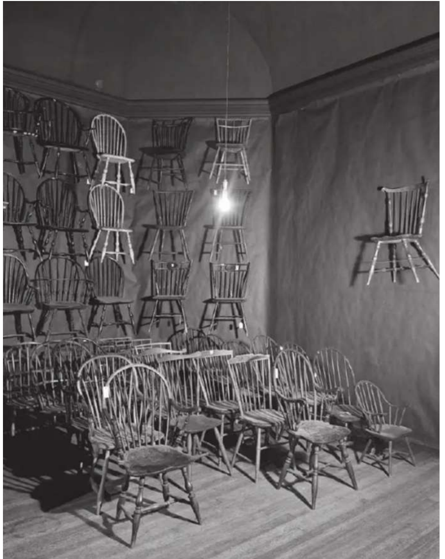
Raid the Icebox 1 with Andy Warhol, vue de l'exposition au Museum of Art, Rhode Island School of Design.