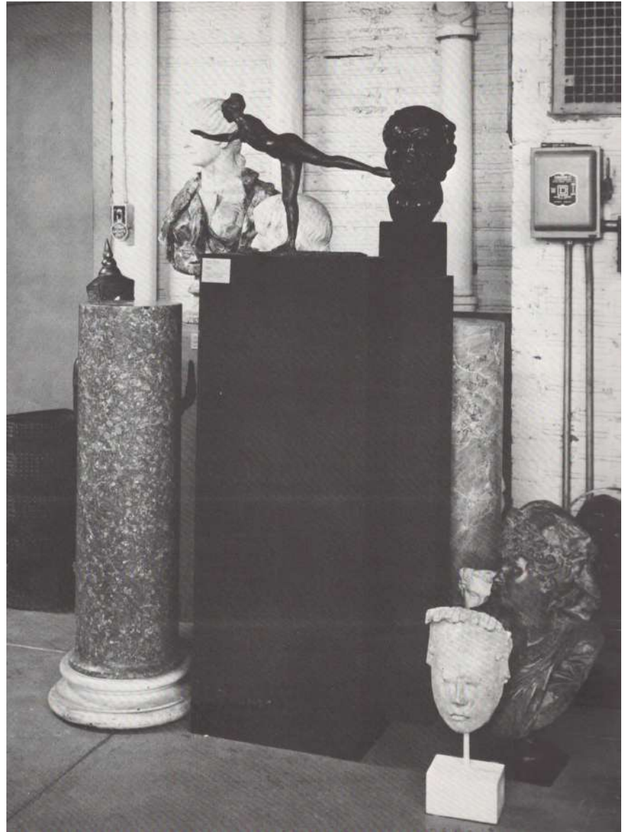
Sculptures dans les réserves.