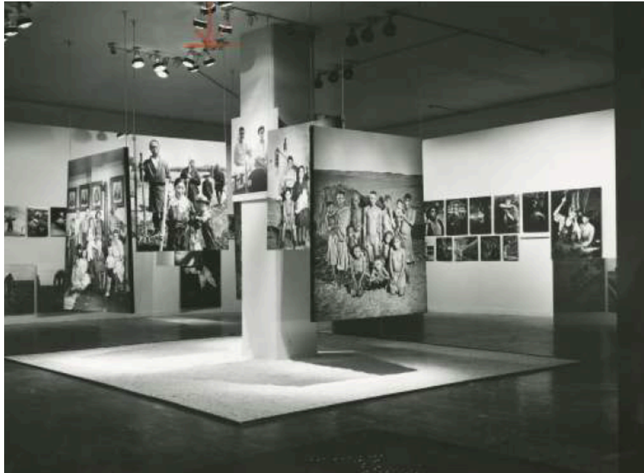
Figure 4 : Vue de l'exposition Family of Man, MoMA, 1955

L'homme quel qu'il soit se trouve toujours face aux mêmes doutes, joies, tourments, douleurs. Le catalogue est le reflet le plus fidèle des intentions d'Edward Steichen. Il est publié en quatre formats différents, à la fois en édition reliée, en brochure de luxe, en version format broché, souple et bon marché et en livre de poche.