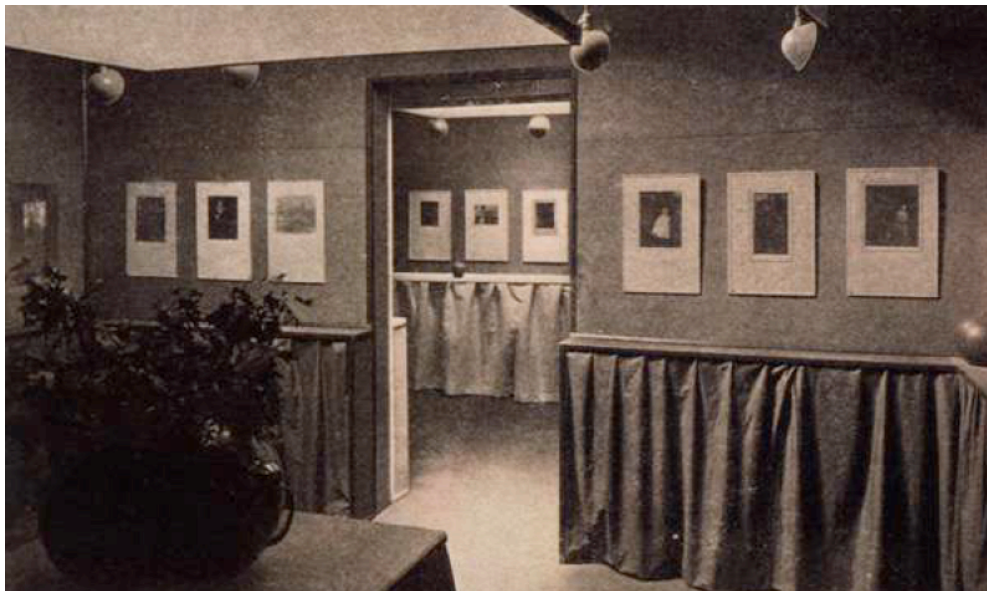
Figure 2 : Vue intérieure de la galerie 291, New York

L'atelier de Stieglitz n'est pas grand mais, il est possible de dégager trois salles afin d'agrandir la galerie. Trois salles en enfilade qui ne permettent pas d'avoir une vue d'ensemble de l'exposition. Le visiteur est à chaque fois confronté à ce problème de ne pas voir l'ensemble des œuvres, ce côté fragmentaire de l'exposition est accentué par les couleurs des murs de chacune des pièces toutes différentes.