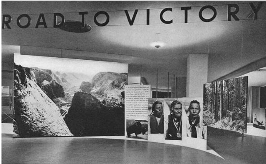
Figure 3 : Entrée de l'exposition Road to Victory, MoMA, 1942

Pour l'exposition « Road to Victory » il est associé au designer Herbert Bayer, ancien professeur de typographie et de design graphique au sein de la célèbre école du Bauhaus à Weimar. Bayer attache une importance capitale à l'aspect cinématographique d'une exposition. Pour lui, une exposition raconte une histoire, ici une histoire par les images. Les images fixes, des photographies peuvent être animées ou sembler l'être par différents stratagèmes. Bayer va avoir une importance fondamentale dans l'approche et dans l'utilisation du médium photographique pour Steichen. L'exposition comme un film ou le spectateur est invité à : « marcher à l'intérieur de la composition » (Barbara Morgan, 1942-1943 : 2863).