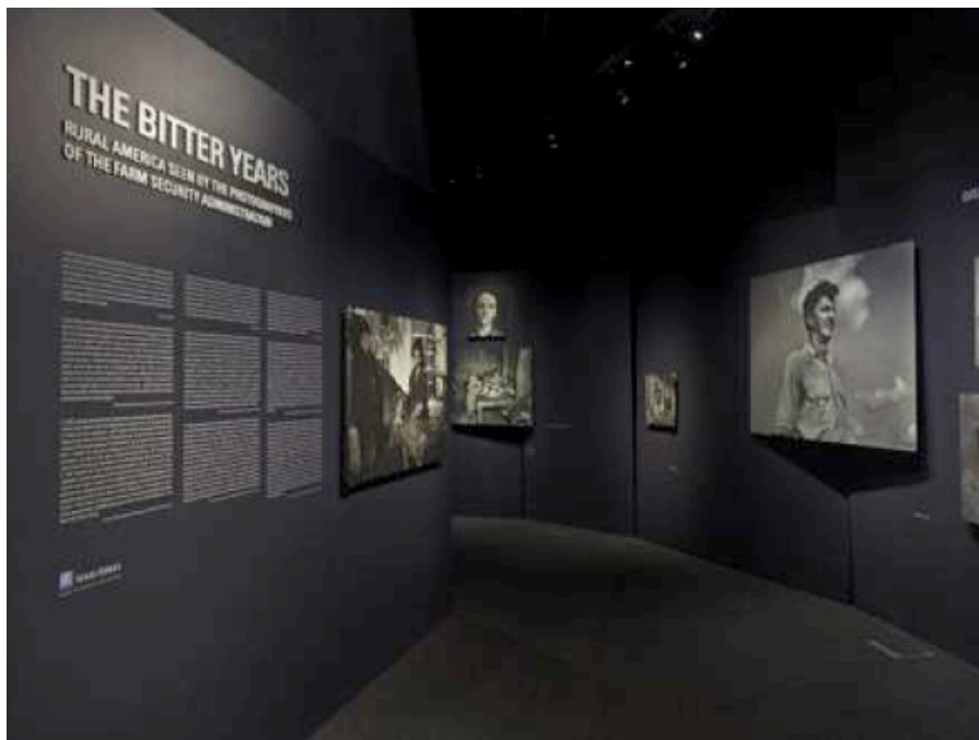
Figure 5 : Vue de la reconstitution de l'exposition The Bitters Years, Château d'eau de Dudelange, Luxembourg, 2011

« The Bitters Years, 1935-1945 USA. Rural America seen by the Photographers of the Farm Security Administration », plus habituellement appelée « The Bitters Years », est la dernière exposition conçue par Edward Steichen. Pour ce faire, il sélectionnera cent huit images des archives de la FSA (Farm Security Administration). La FSA est une mission documentaire mise en place par le président américain Franklin D. Roosevelt dans le cadre du New Deal. Steichen qui avait sélectionné ses photographies, le fit sans demander d'autorisation aux photographes. De nombreux photographes célèbres sont ici représentés, souvent par plusieurs photographies, ainsi Russell Lee est présent avec vingt-deux photographies, Dorothea Lange avec quatre-vingt-quatre, Arthur Rothstein avec vingt, Jack Delano dix-sept, Walker Evans seize, Paul Carter et Theodor Jung, une à deux images.