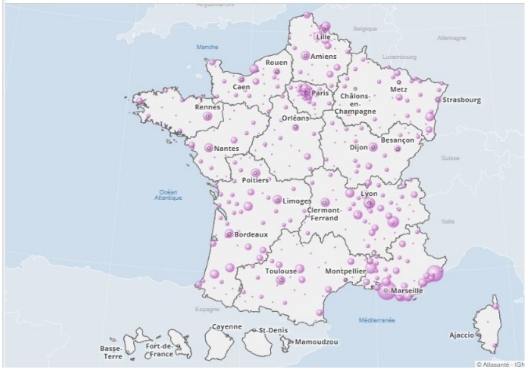
1 Nombre de passages aux urgences pour l'indicateur chaleur