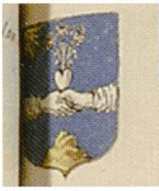
Fig. 13. Armoiries de Blaize Ignace Baudon, Armorial général , Provence II, 1171.