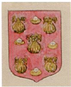
Fig. 18. Armoiries de Gabriel Baudon, Armorial général , Bourges, 22.