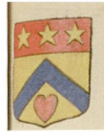
Fig. 23. Armoiries de Pierre Bardon, Armorial général , Provence II, 1447.