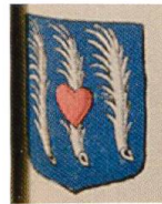
Fig. 27. Armoiries de Joseph Deydier, Armorial général , Auvergne, 195.