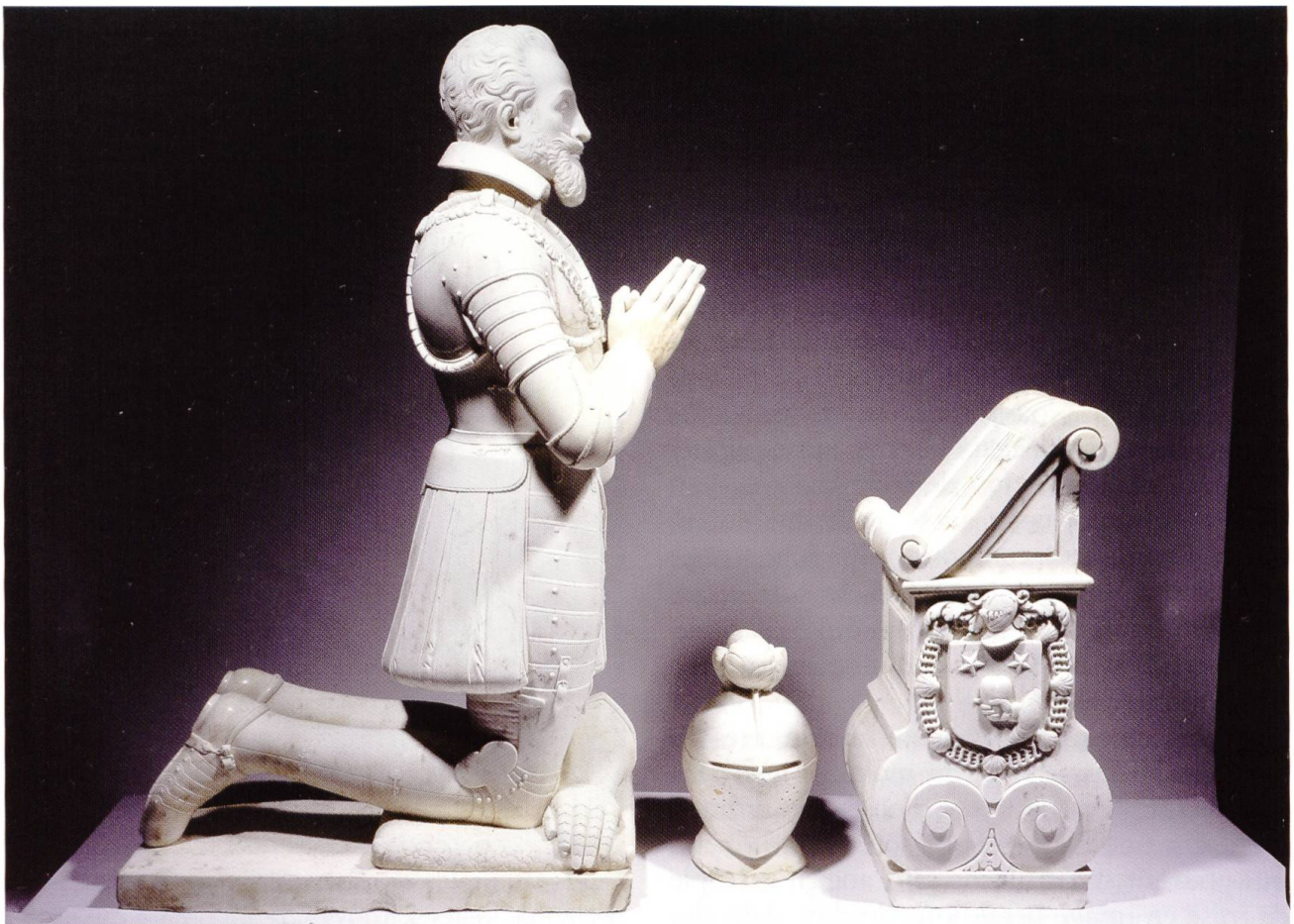
Fig. 1. Monument funéraire de Pierre Donadiou de Puycharic, et ses armoiries (© Musées d'Angers, cliché Pierre David).

Comminges afin de se rapprocher du berceau familial, il tomba gravement malade avant d'avoir pu prendre possession du siège. Revenu à la santé, il interpréta sa rémission comme le signe que Dieu lui demandait de résigner son évêché de Comminges ; aussi le confia-t-il à son neveu et fils adoptif, Barthélemy de Griet, dont il fut un des vicaires généraux et auquel il survécut. Décédé en 1640, François de Donadiou fut enseveli devant le grand autel de la cathédrale de Comminges, où la pierre tombale à ses armes subsiste 5 .