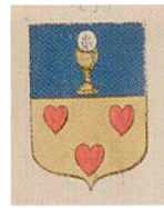
Fig. 6. Armoiries d'Etienne Donnadiu, Armorial général , Languedoc II, 1596.