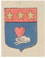
Fig. 4. Armoiries de Louis Donnadiou, Armorial général , Languedoc II, 1912.