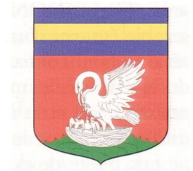
Fig. 16–17. Armoiries de la famille Baudon, Ile-de-France ( Armorial Dubuisson ), et de la famille Donan (dessin B. de Lépinay).

armes des Baudon toulonnais, le soleil redouble partiellement l'aspect parlant des armoiries. En Dauphiné, la famille Donan a elle aussi retenu la figure du pélican comme figure parlante du don. En effet, d'après Rietstap, ses armoiries sont de gueules, à un pélican de profil, avec ses petits d'argent, posé sur un tertre au naturel, au chef d'azur chargé d'une fasce d'or (fig. 17) 47 .