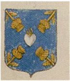
Fig. 21. Armoiries de Louis Cardon, Armorial général , Picardie, 236.