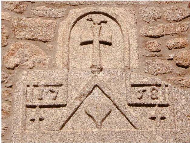
Fig. 25. Linteau de porte, hameau du Droc, commune du Nayrac, Aveyron.

du nom de baptême Didier, lui-même issu du latin desideratus , signifiant « désiré » 55 . Dans les armes de Joseph Deidier, d'azur à trois palmes d'argent rangées en fasce, au cœur de gueules brochant sur celle du milieu (fig. 27), les palmes constituent probablement un emblème parlant servant à évoquer saint Didier, martyr. Le statut du cœur est plus ambigu : s'agit-il de celui du saint, qui accepta la mort par amour de Dieu, ou de celui de la famille Deydier, qui se voue ainsi à son saint patron ?