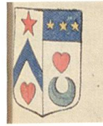
Fig. 28. Armoiries de Claude Daidier, Armorial général , Provence II, 1641.