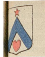
Fig. 29. Armoiries de Joseph Deidier, Armorial général , Provence II, 1777.

les armoiries des Bardon, une mise en image du don du cœur à Dieu : les armes des Deidier figureraient donc bien un cœur « dédié » à Dieu.