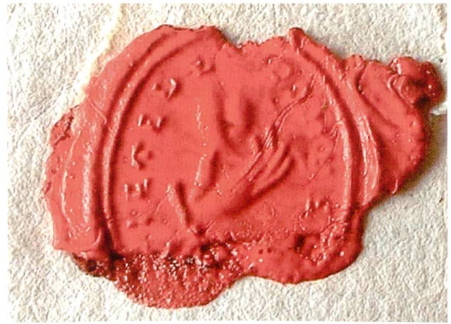
Fig. 12. Cachet montrant un cœur offert.