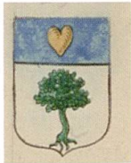
Fig. 20. Armoiries de Gaspard Faudon, Armorial général , Provence II, 1940.

d'argent, taillés en losanges et enchâssés d'or (fig. 18) 48 . Des quatre écus Baudon présentés ici, c'est le plus véral : point n'est ici question d'amour ou de spiritualité, mais d'un « beau don » sonnante et trébuchant. Cet exemple reste toutefois isolé : lorsque les familles Baudon sont à l'origine des armoiries qu'elles portent, les meubles choisis pour évoquer le don renvoient au don de la vie, symbolisé par le cœur ou le pélican se sacrifiant pour ses petits.