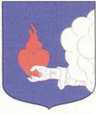
Fig. 11. Armoiries de la famille Baudon, Franche-Comté (dessin B. de Lépinay).

super emineat charitas » 36 , tandis que l'abbaye cistercienne de Morimond, en Champagne, qui a souvent varié ses armoiries, a fait usage au XVII e siècle d'un écu montrant une main vêtue, son avant bras mouvant de senestre, tenant un cœur enflammé 37 .