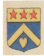
Fig. 24. Armoiries de Louis Bardon, Armorial général , Provence II, 1666.

cœur enflammé, figure d'un « cher don » en tant que symbole de la charité.