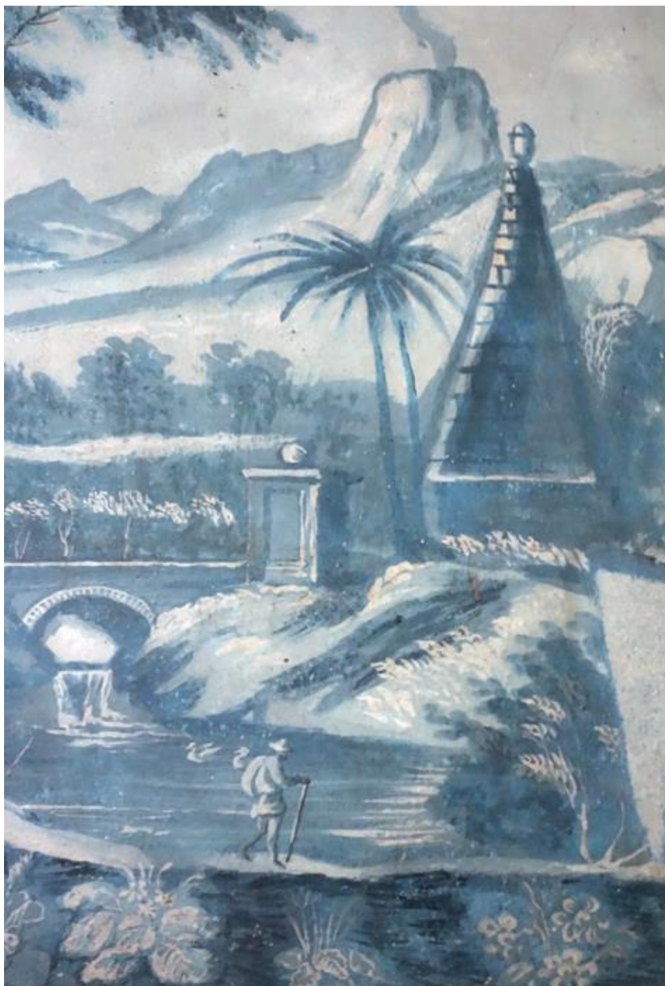
Joseph Vernet (1714-1789)

Joseph Vernet étant très connu à l'époque où a été exécuté le décor de Die, il n'y a rien d'étonnant à ce que notre peintre affectionne également un des thèmes favoris de Vernet : les marines. Les ports, les vaisseaux, le commerce participent du développement du despotisme éclairé. Il y en a beaucoup chez Pillement, mais bien plus encore chez l'Avignonnais Joseph Vernet 30 : ses scènes de naufrage, de