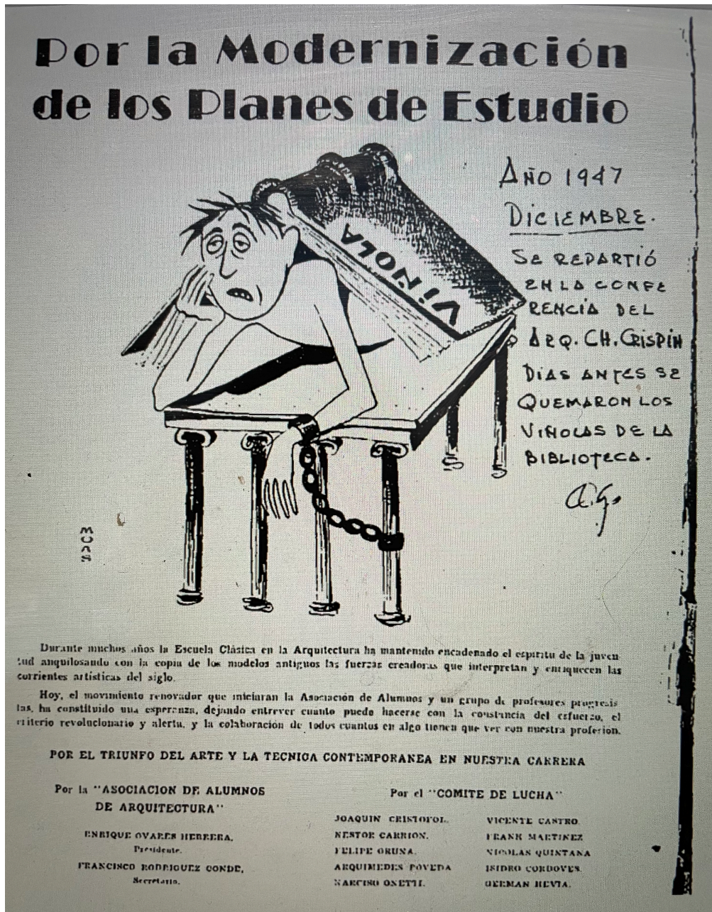
FIG 3: Tract distribué aux étudiants par le « Comité de lutte » peu avant l'incident de Las quema del Vignola en décembre 1947.

d'exemplaires des Traité de Vignola dans la cour centrale de l'École. Cet événement représente un acte symbolique de rupture des nouvelles générations contre l'académisme opérant dans l'enseignement de l'architecture et marque le moment le plus controversé de la première révolte estudiantine de l'histoire de l'Université de La Havane [FIG1].