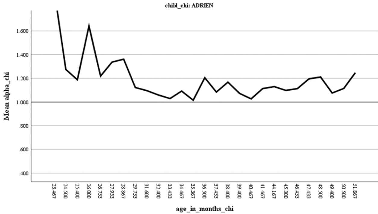
Figure 2. Evolution de l'exposant alpha pour Adrien