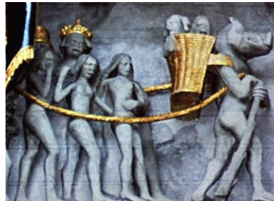
Cathédrale Saint-Nicolas de Fribourg.

Ainsi, le couple antonymique mort vs fertilité est décliné jusqu'aux moindres ramifications dans notre histoire et autour de notre saint – qui a donc aussi un côté diabolique, qui transparaît parfois très nettement en particulier lorsqu'il est flanqué du Fouettard. Il existe d'ailleurs une sculpture très spéciale sur le portail de la Cathédrale de Fribourg - devinez à qui elle est consacrée ? - à saint Nicolas précisément ; il est aussi le patron de la ville d'ailleurs. C'est un diable avec une tête de porc, qui porte un croc à la main et surtout, une hotte sur le dos. Que peut bien ramasser le diable dans sa hotte, sinon des âmes ? On voit donc ici le transfert de Nicolas au diable par le truchement de cet objet apparemment inoffensif qu'est la hotte.