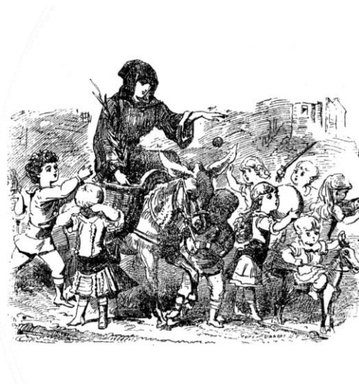
© K. Ueltschi, Histoire véridique du Père Noël , Paris, Imago, 2012/2021

La tante Arie des pays alpins lui ressemble un peu. Cette dernière est ronde et confortable, elle annonce sa venue avec une clochette et elle est munie tantôt d'un bâton, tantôt de verges, mais toujours accompagnée d'une ânesse. Elle est enveloppée dans une ample pèlerine et porte le fameux bonnet à « diairie », altération de « Arie » qui désigne en même temps le bonnet en broderie blanche du pays de Montbéliard. Ambivalente elle aussi, elle punit (avec les verges, voire en distribuant des bonnets d'âne !) ou elle récompense. Elle laisse ses présents dans les sabots mis devant la cheminée ou sur la fenêtre ; les enfants qui auront aussi pensé à l'ânesse. Une chanson franche-comtoise dit :