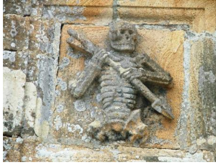
L'Ankou de l'ossuaire de Plouidry (29)