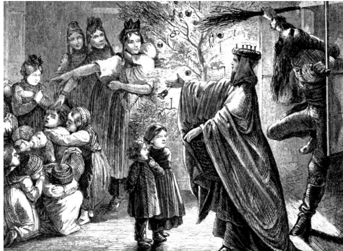
©K. Ueltschi, Histoire véridique du Père Noël , Paris, Imago, 2012/2021

Évoquons aussi Krampus qui accompagne saint Nicolas en Autriche. Souvent, ils sont plusieurs Krampusse qui se distinguent par le tintement de leurs cloches et leur masque noir, leurs peaux de mouton et leur fouet, ainsi que par les cornes de bélier et de bouc qu'ils arborent. On est encore ici dans le registre de l'homo sylvestris . Dans le même registre, si on se rend le 31 décembre en Suisse dans la région de l'Appenzell, on aurait la surprise ou plutôt la frayeur d'assister à un horrible défilé de masques diaboliques secouant force cloches, et que l'on appelle – les Nicolas !