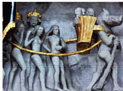
Cathédrale Saint-Nicolas de Fribourg. Photo et arrangement Claude Lecouteux. Avec son aimable autorisation.

Ainsi, le couple antonymique mort vs fertilité est décliné jusqu'aux moindres ramifications dans notre histoire et autour de notre saint – qui a donc aussi un côté diabolique, qui transparaît parfois très nettement en particulier lorsqu'il est flanqué du Fouettard. Il existe d'ailleurs une sculpture très spéciale sur le portail de la Cathédrale de Fribourg - devinez à qui elle est consacrée ? - à saint Nicolas précisément ; il est aussi le patron de la ville d'ailleurs. C'est un diable avec une tête de porc, qui porte un croc à la main et surtout, une hotte sur le dos. Que peut bien ramasser le diable dans sa hotte, sinon des âmes ? On voit donc ici le transfert de Nicolas au diable par le truchement de cet objet apparemment inoffensif qu'est la hotte.