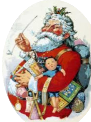
Clément Moore et Thomas Nast

La barbe, la cape et tous ses avatars ou variantes – coule, capuche, chapeau, masques – constituent une métaphore de l'invisibilité et de la métamorphose perpétuelle d'une identité à jamais fuyante. Qui se cache sous la barbe, qui se cache sous le capuchon ?