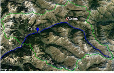
FIGURE 1 : Le bassin du Guil et Abriès.

d'entraînement et de validation. Le reste du bassin est réservé pour la phase de test. La période choisie va de juillet 2018 à décembre 2019, de sorte à disposer d'un hiver hydrologique complet et le début de l'hiver suivant.