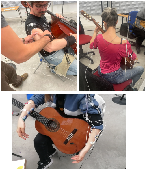
Figure 2. Exemples de positionnement des électrodes lors des trois études menées.

Les électrodes placés sur l'épaule donnent un signal de la même qualité que celui obtenu sur l'avant-bras (cf. figure 2).